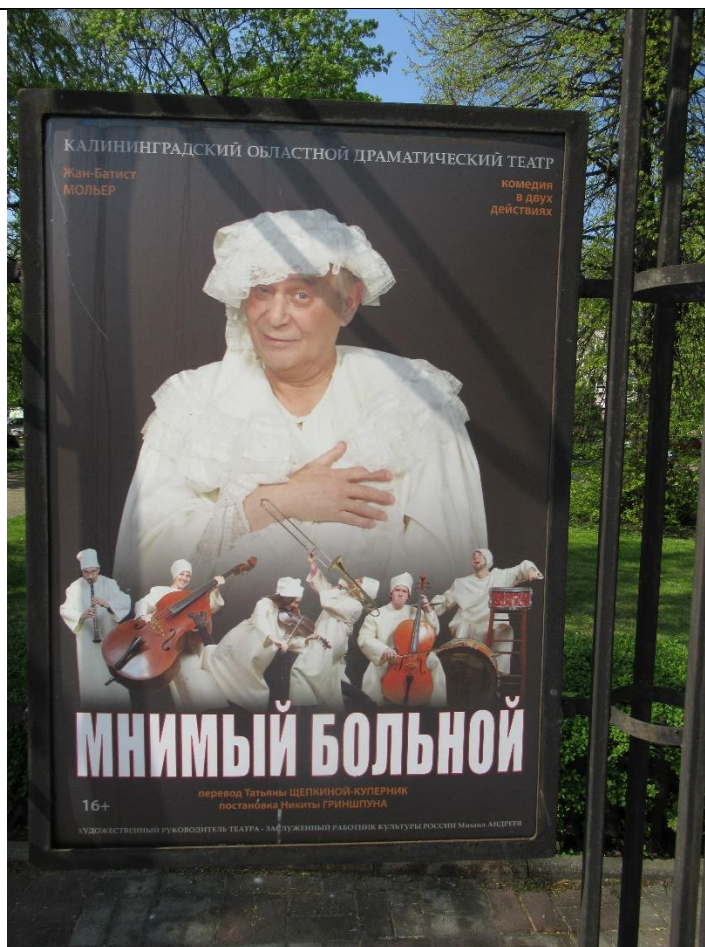
Plakat teatralny – akurat grali „Chorego z urojenia” – Moliera – genialna realizacja!!!! Zobaczcie Państwo zespół muzyczny....