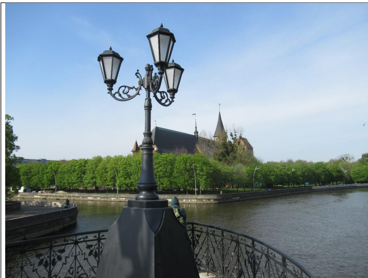
Na rzece Pregole – jest wyspa z Katedrą, w która dziś jest muzeum oraz sala koncertowa