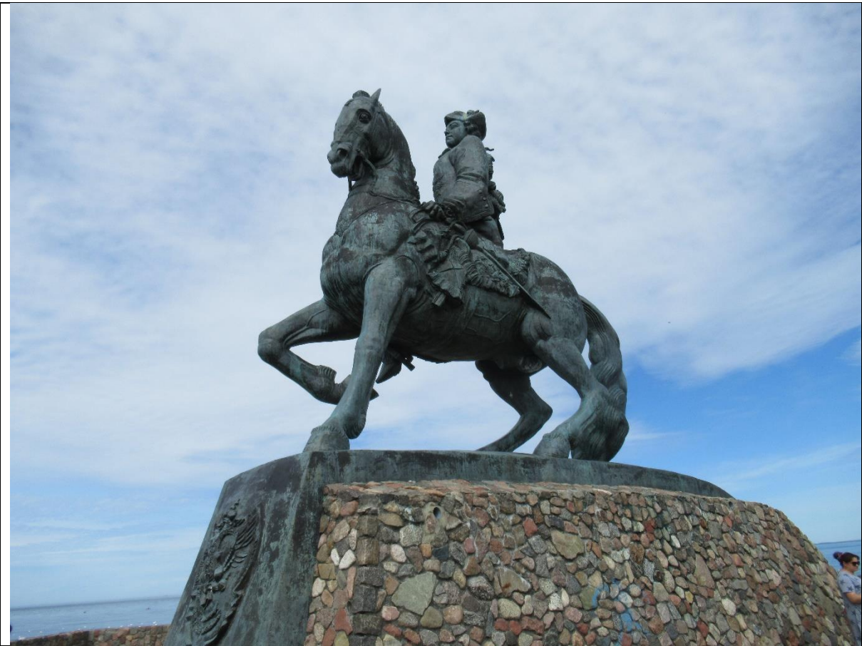
Pomnik Imperatorowej Elżbiety Piotrowny