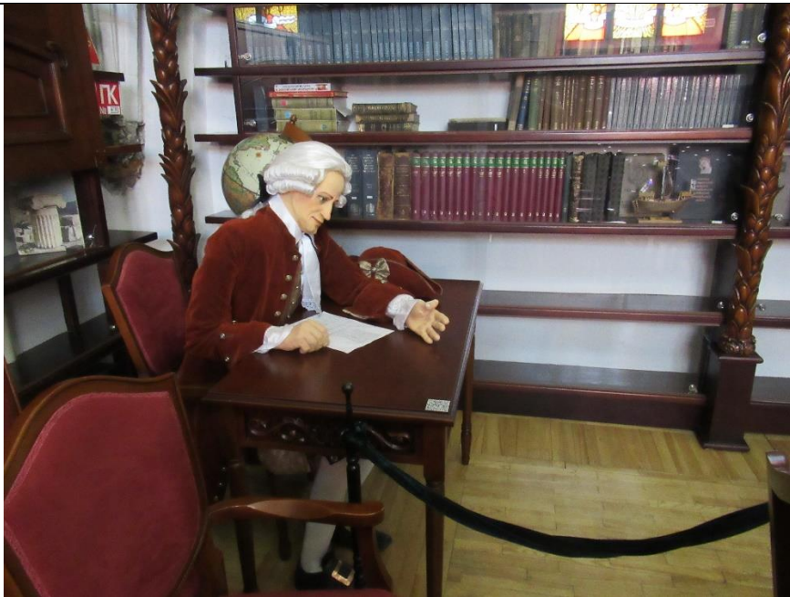
Kaliningrad to dawny Królewiec, gdzie żył Immanuel Kant – niemiecki filozof