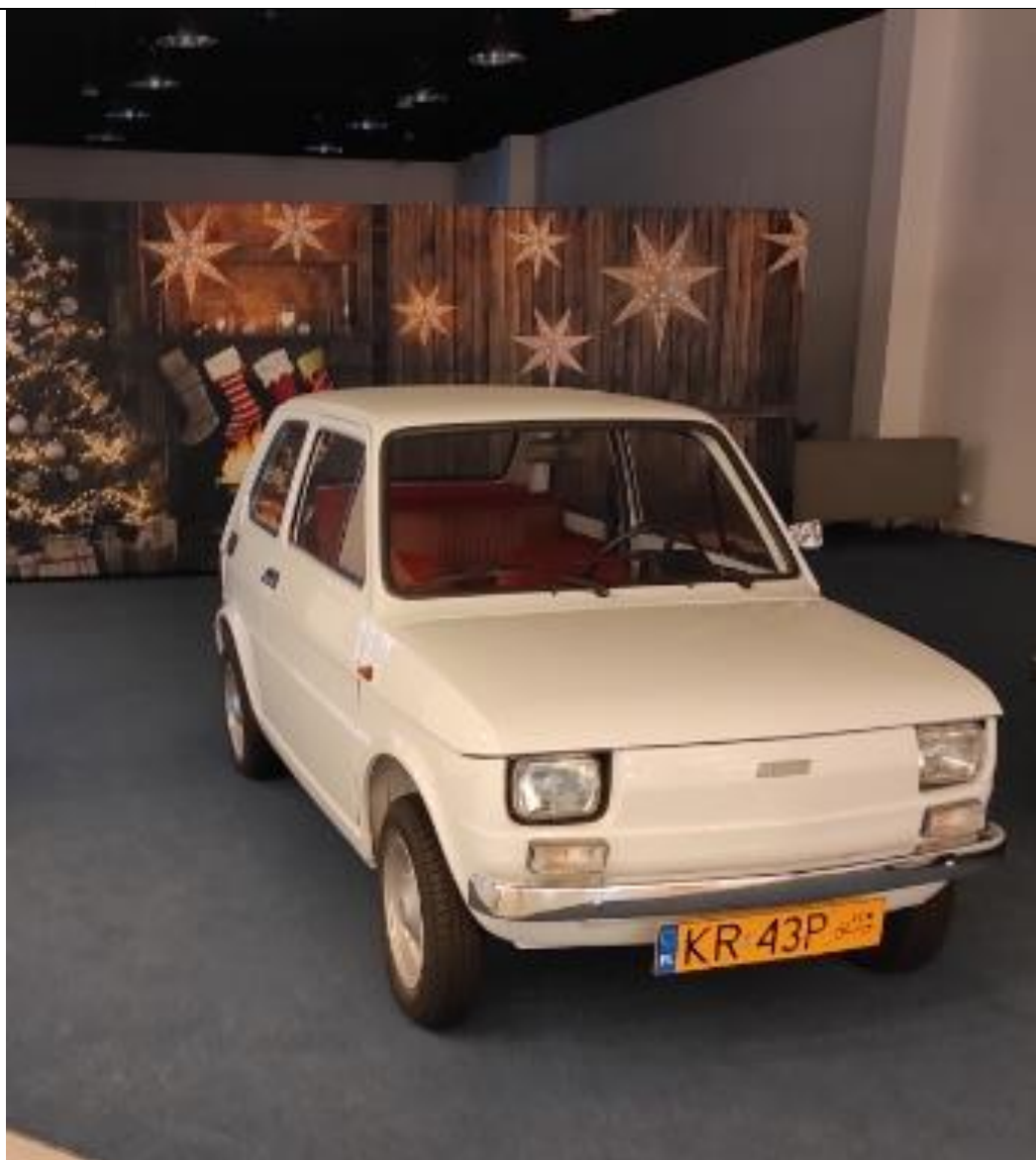
Mały FIAT – dodatkowy bohater CZTERDZIESTOLATKA