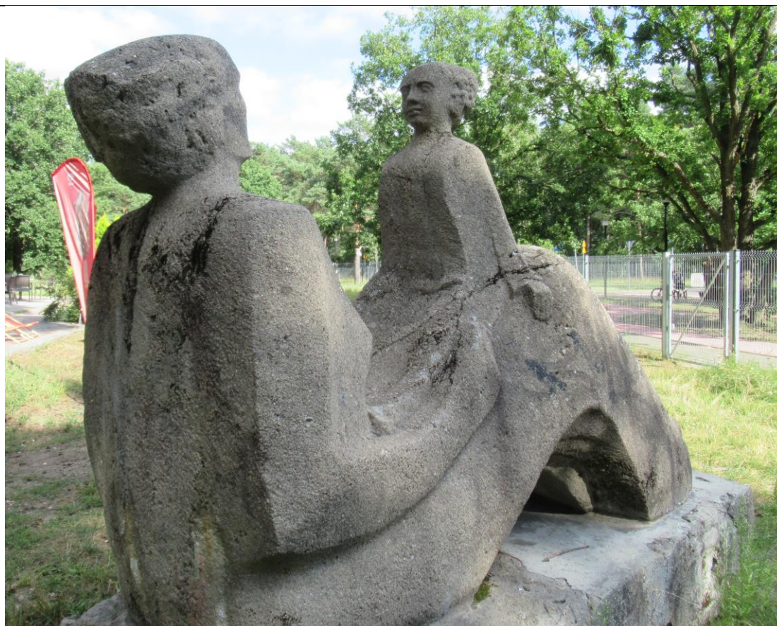
Pomnik matki i córki w parku w Bydgoszczy