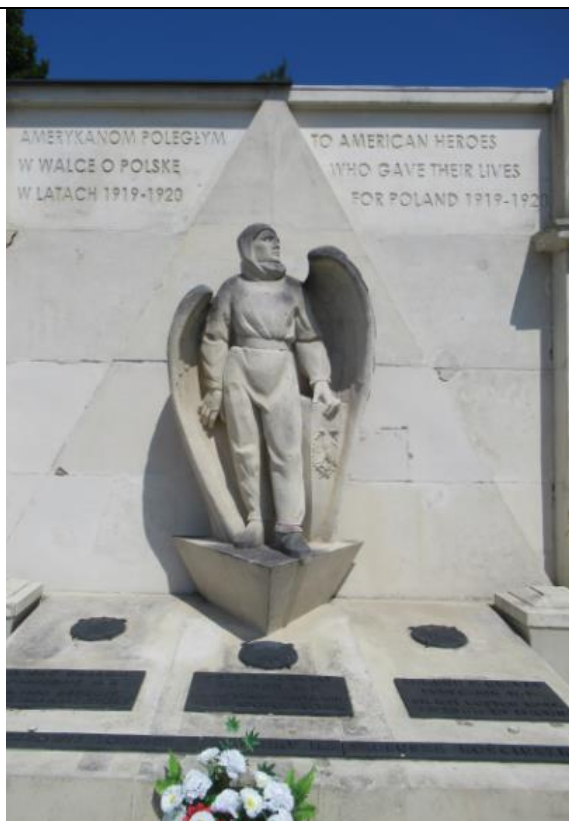
Pomniki dla sojuszników