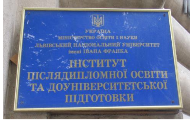
Tablice informacyjne wydziałów