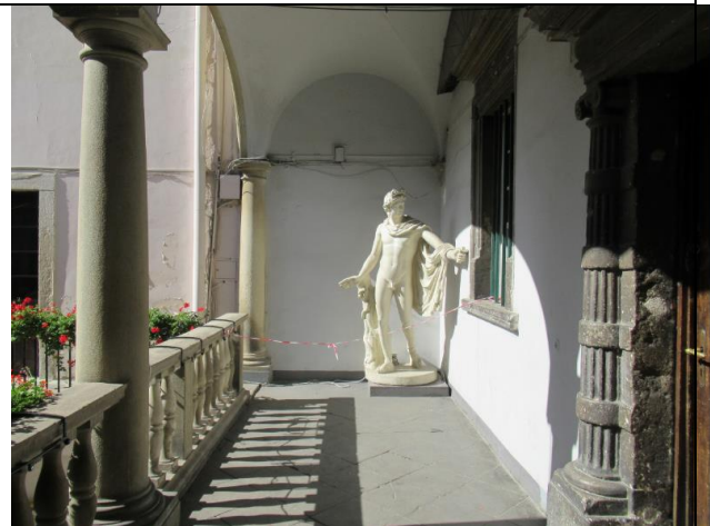
Na dziedzińcu muzeum mieści się urocza restauracja i kawiarnia.