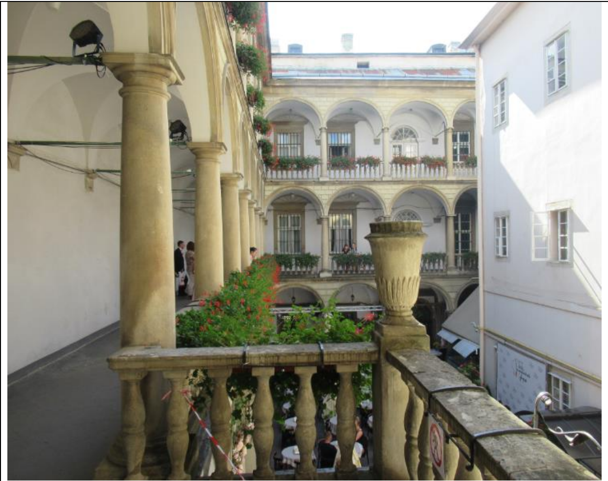
Cmentarz Łyczakowski we Lwowie