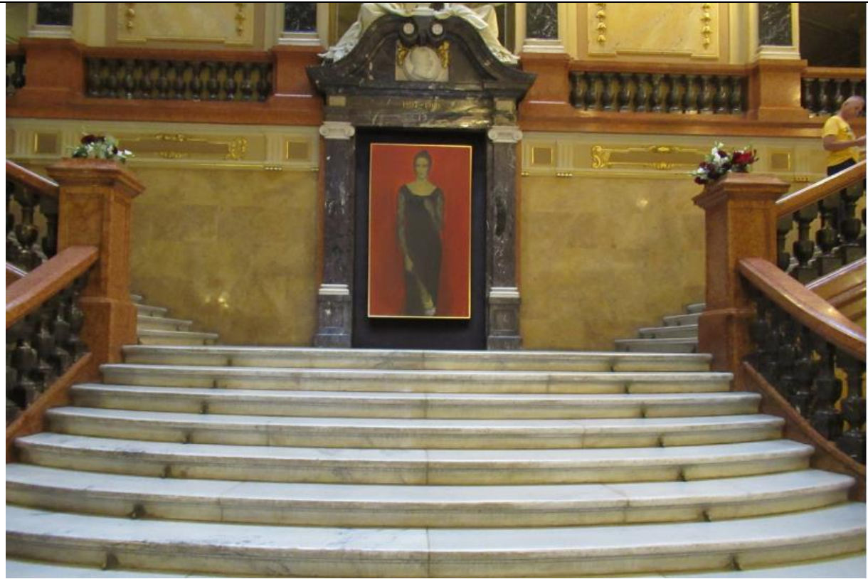
Muzeum Historyczne we Lwowie