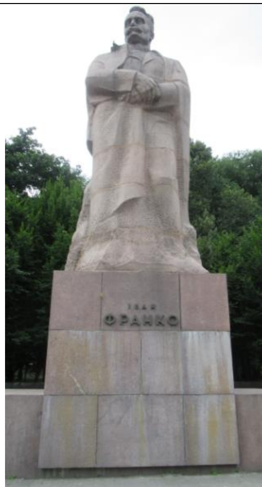
Iwan Franko – Patron Dziejniejszego Uniwersytetu