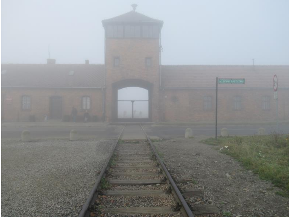
KL AUSCHWITZ II BIRKENAU