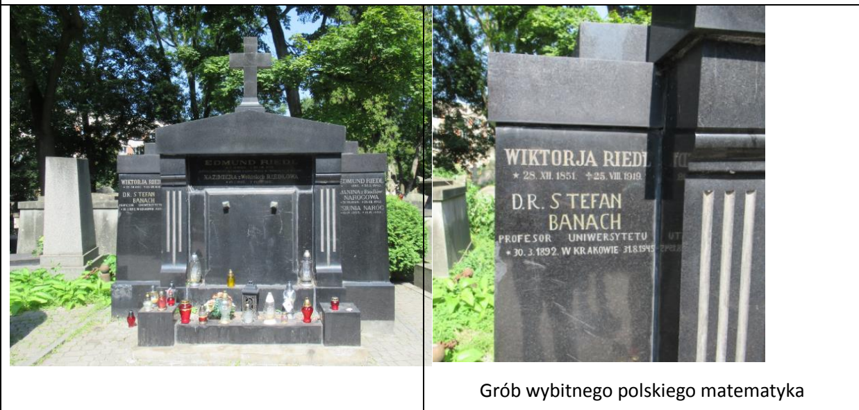
Grób wybitnego polskiego matematyka