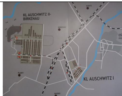
KL AUSCHWITZ I