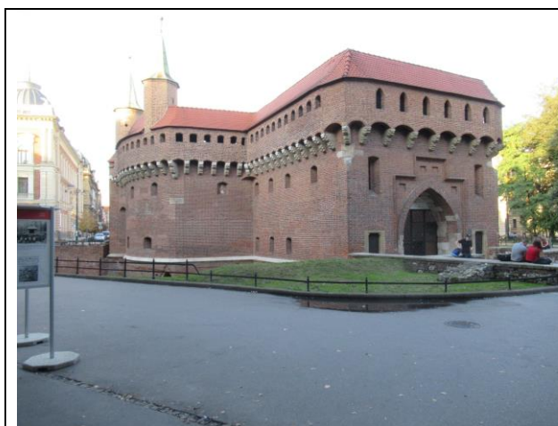
Barbakan – spacerzy z ojcem