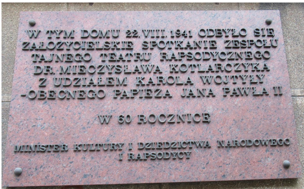
Tablica pamiątkowa (widoczna poprzednio przy wejściu)