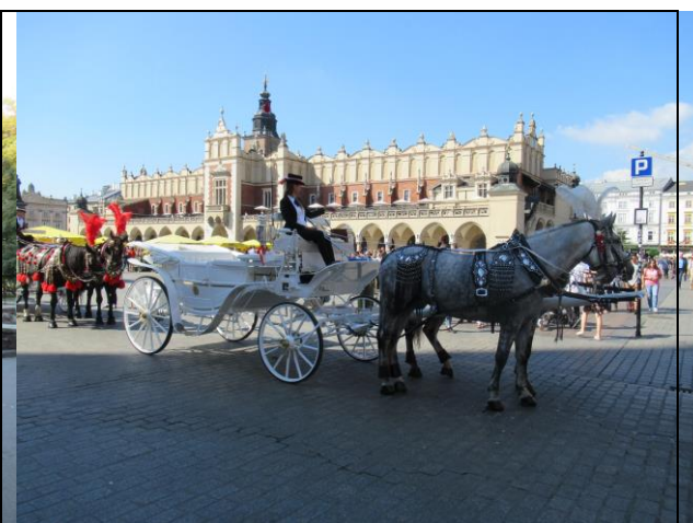
Rynek Główny w Krakowie