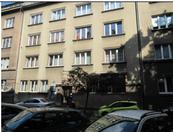
Miejsce gdzie odbyło się zebranie założycielskie TEATRU RAPSODYCZNEGO Kraków, ul. Komorowskiego 7, II piętro