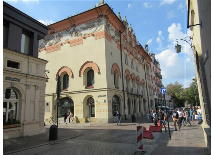
Teatr Stary w Krakowie, gdzie pracowała Bohaterka odcinka