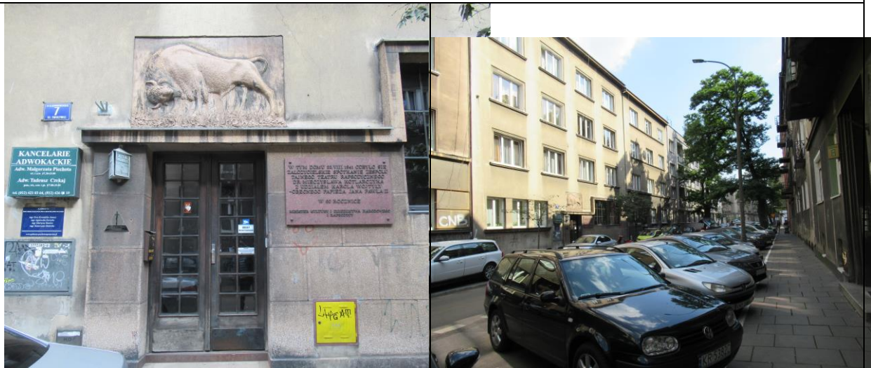
Drzwi wejściowe, obok tablica pamiątkowa