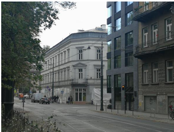
Budynek PWST im. Ludwika Solskiego