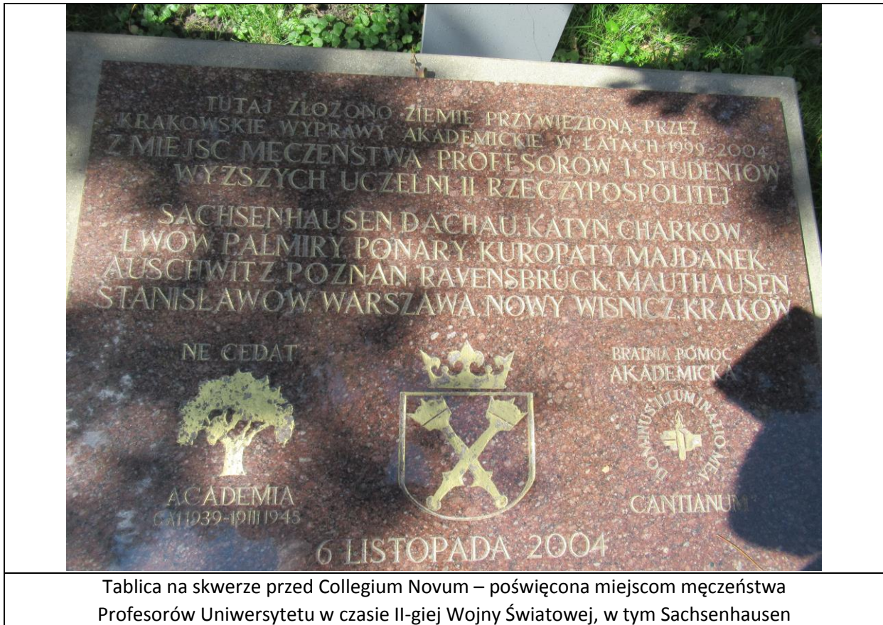
Tablica na skwerze przed Collegium Novum – poświęcona miejscom męczeństwa Profesorów Uniwersytetu w czasie II-giej Wojny Światowej, w tym Sachsenhausen