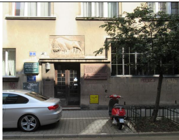
Kamienica i wejście