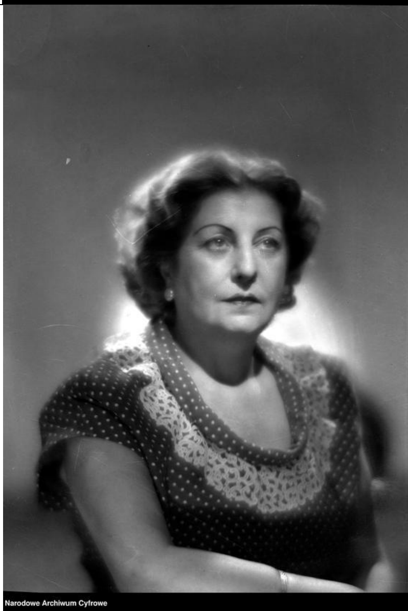
Narodowe Archiwum Cyfrowe

Warto kliknąć na zasoby NAC - zdjęć jest jeszcze kilkanaście!!!