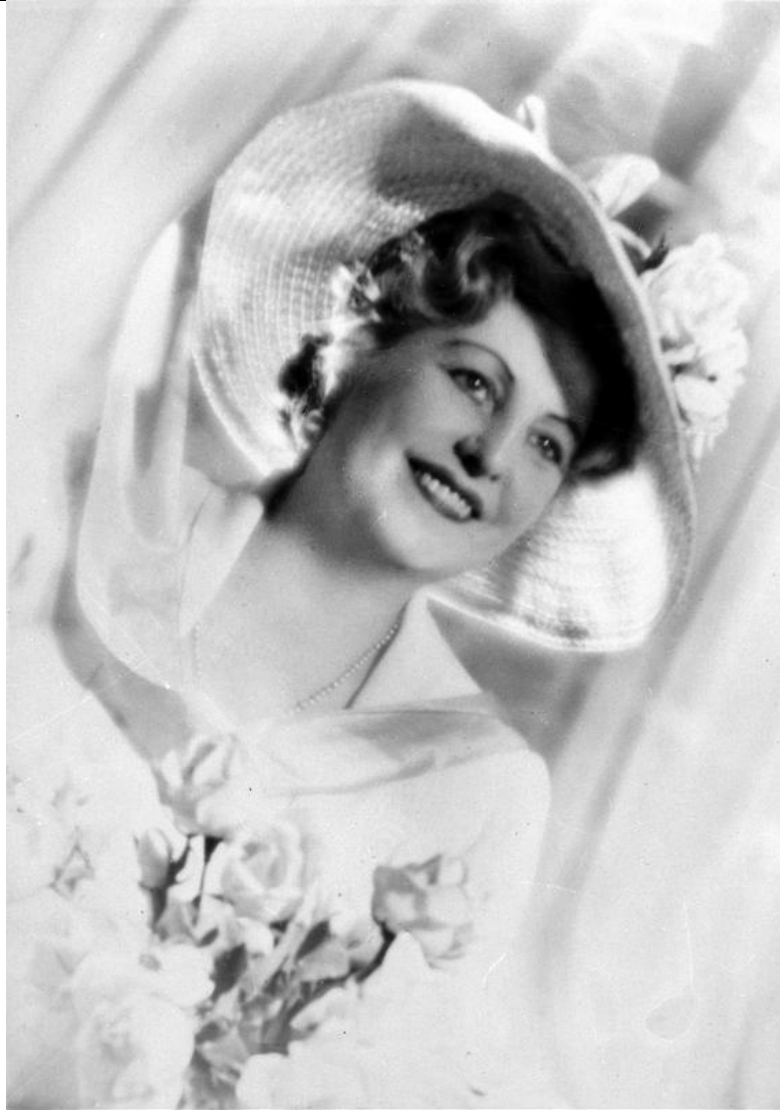
Narodowe Archiwum Cyfrowe