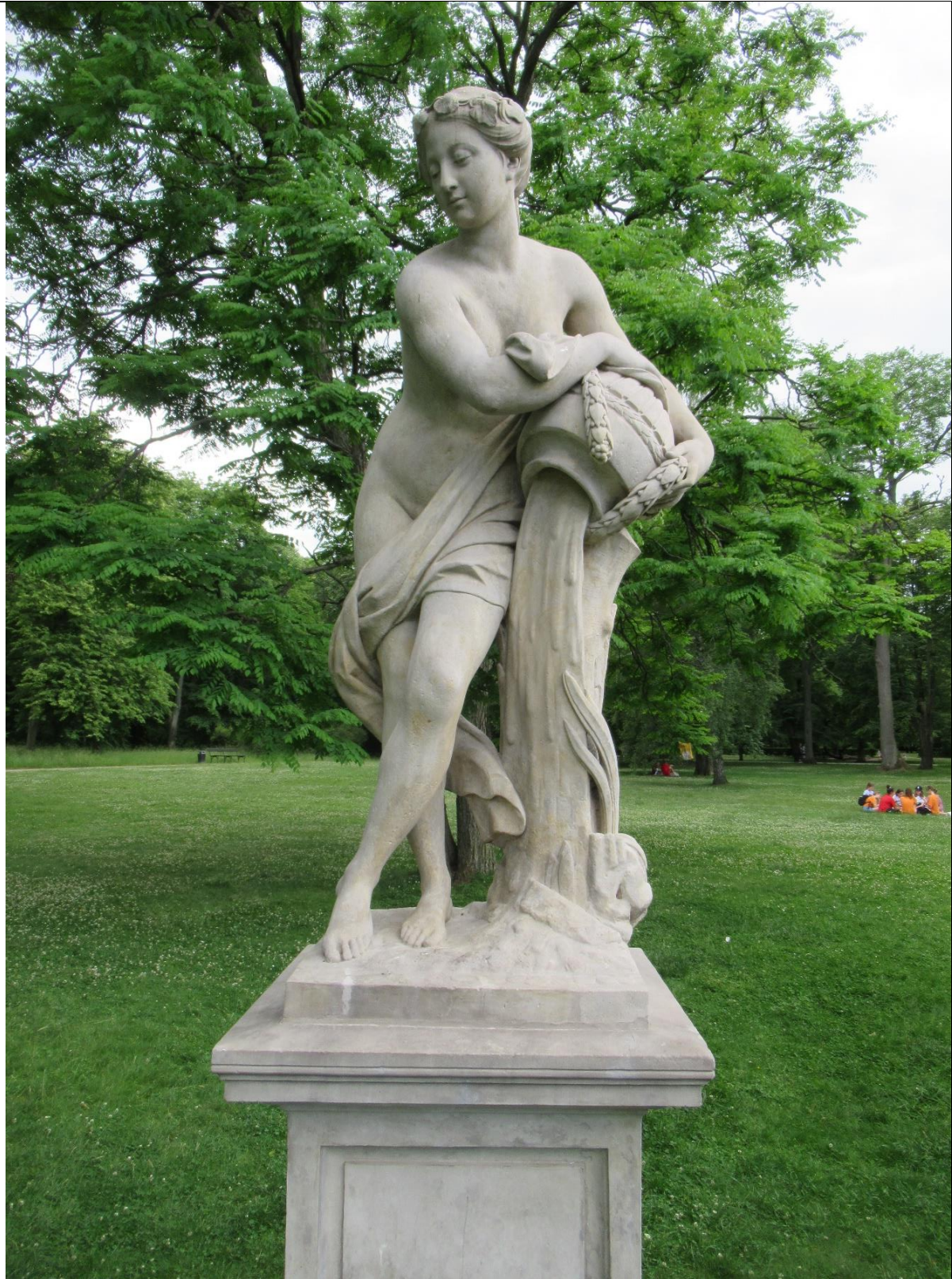
Rzeźba w Parku Łazienkowskim w Warszawie