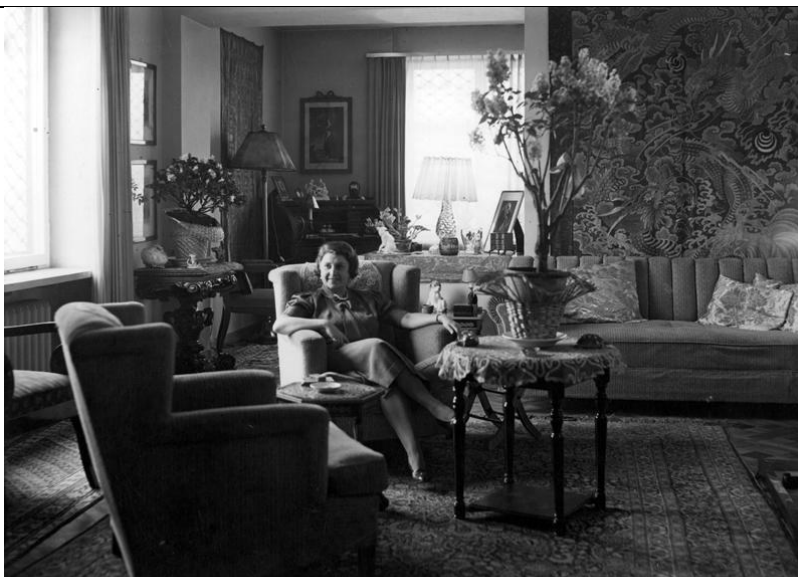
Narodowe Archiwum Cyfrowe