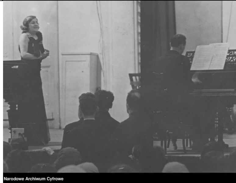
Narodowe Archiwum Cyfrowe