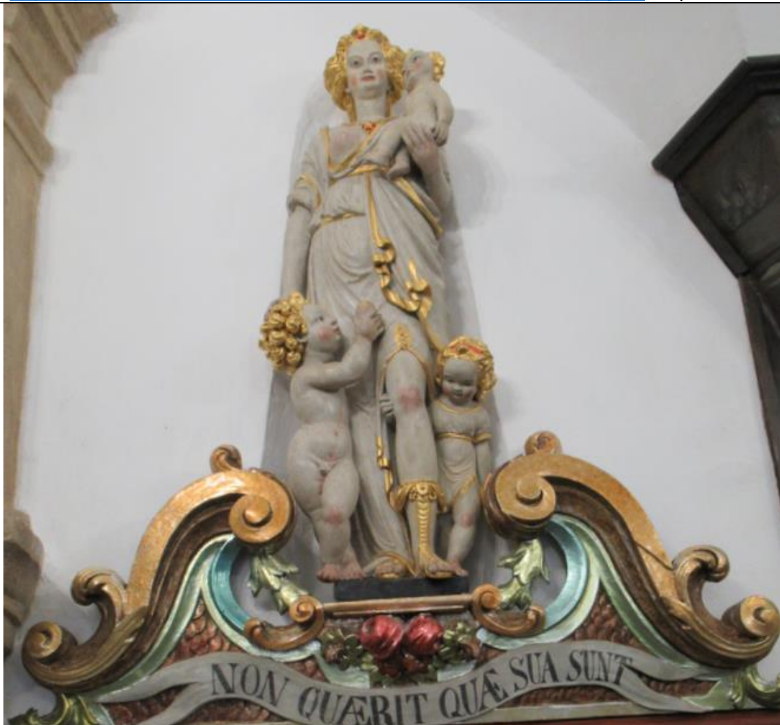
Rzeźba w Muzeum Miejskim w Chełmnie. MIŁOŚĆ?

https://polona.pl/item-view/af5aa1b5-e528-476c-9ccc-5efce2c29bcc?page=0 ; cały dokument.