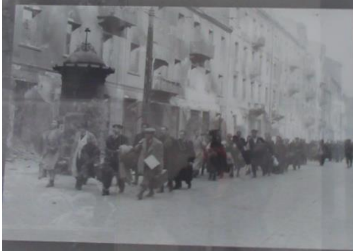
W Parku Pamięci są galerie zdjęć: powyżej z Getta; poniżej: z Auschwitz.