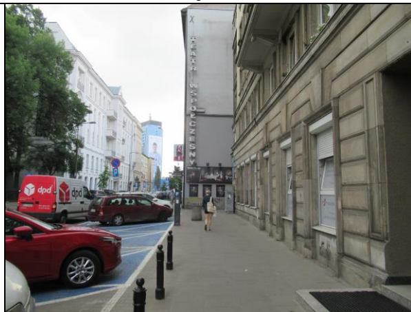
Teatr Współczesny, w kamienicy!!! Warszawa