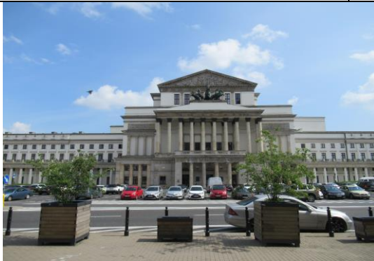
Teatr Narodowy w Warszawie