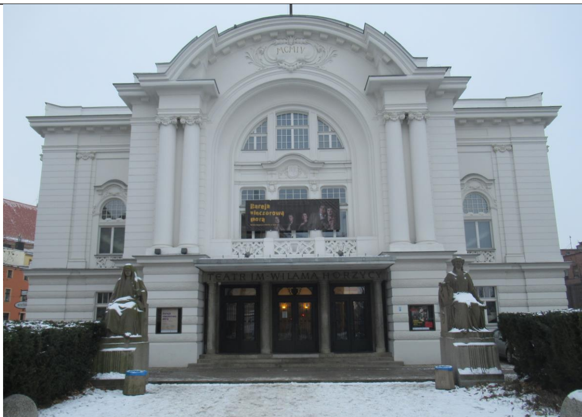
Pięknie odnowiony budynek teatru w Toruniu.

Toruń – tu nasza Bohaterka grywała w Teatrze im. Wilama Horzycy