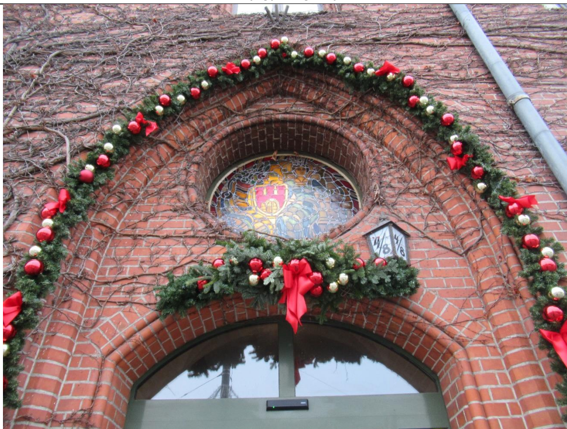
Wejście do Ratusza