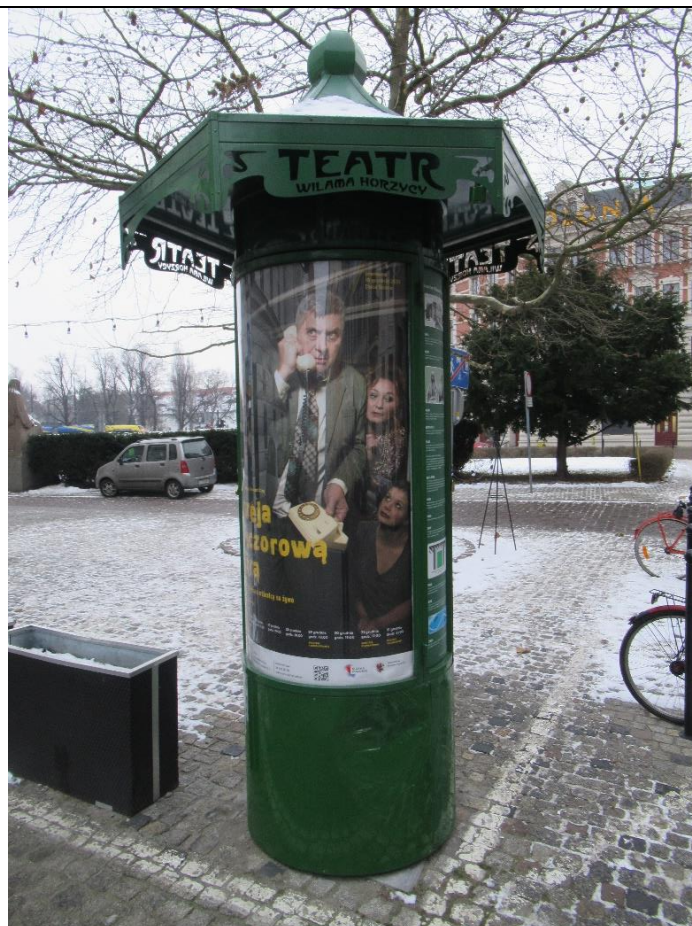
Akurat grają „ Bareja wieczorową porą ” – na tydzień naprzód – bilety wysprzedane