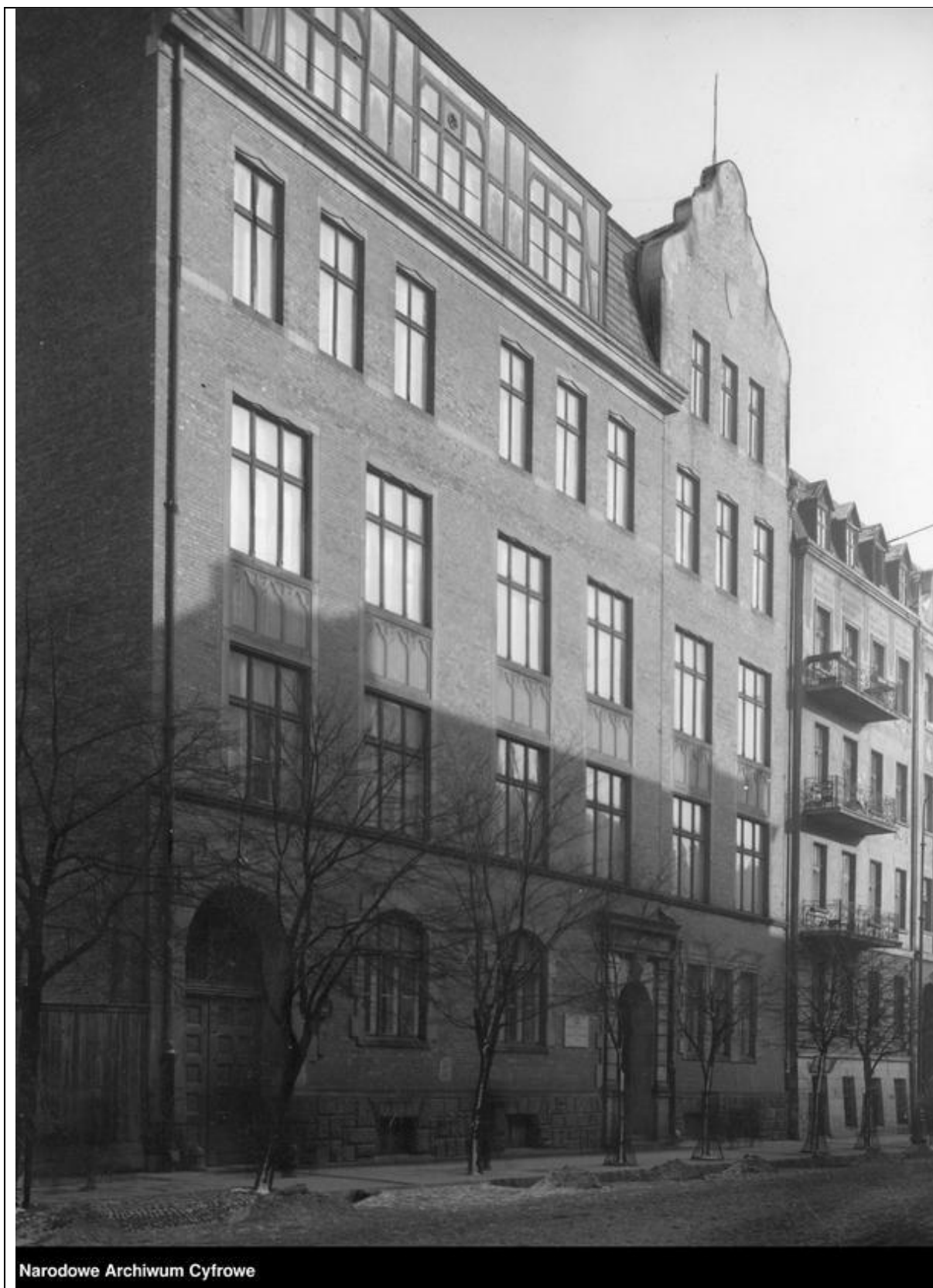
Narodowe Archiwum Cyfrowe