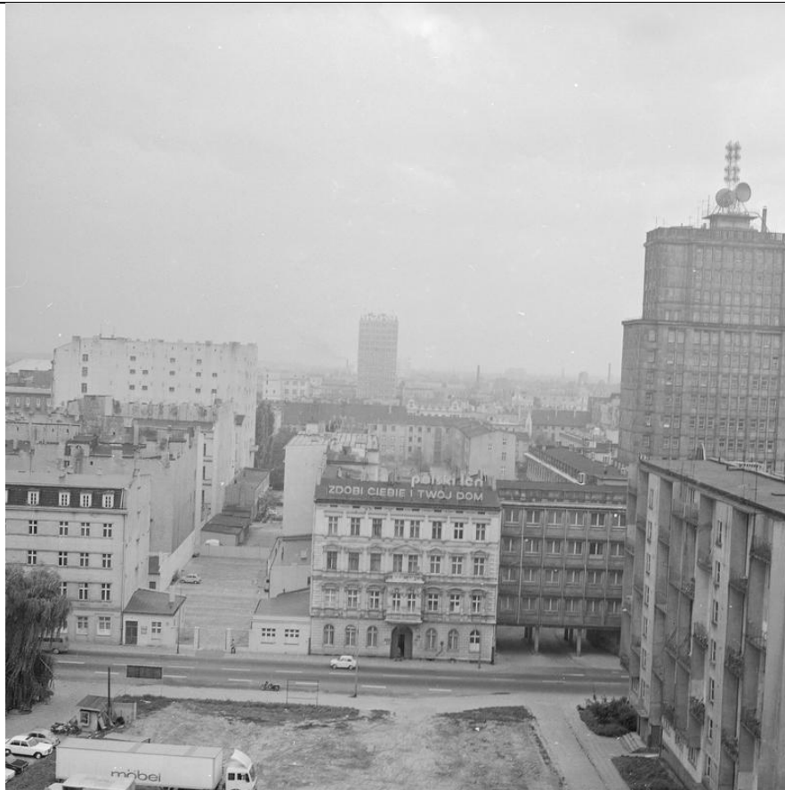
Narodowe Archiwum Cyfrowe