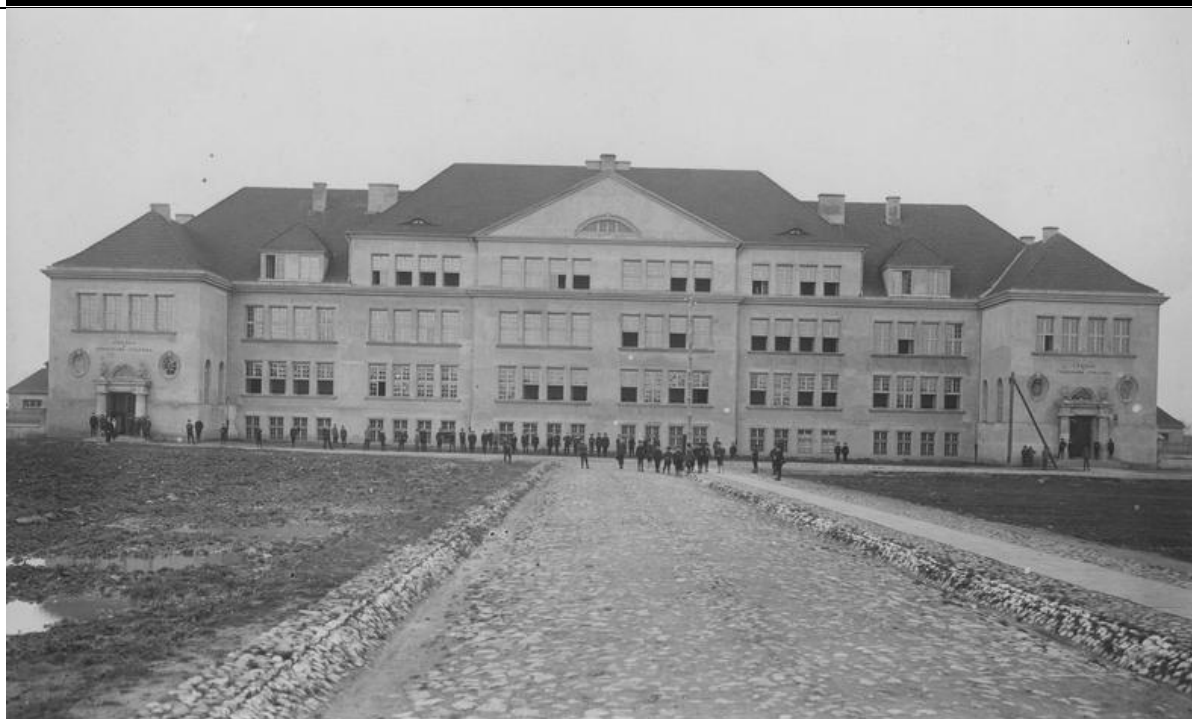
Narodowe Archiwum Cyfrowe