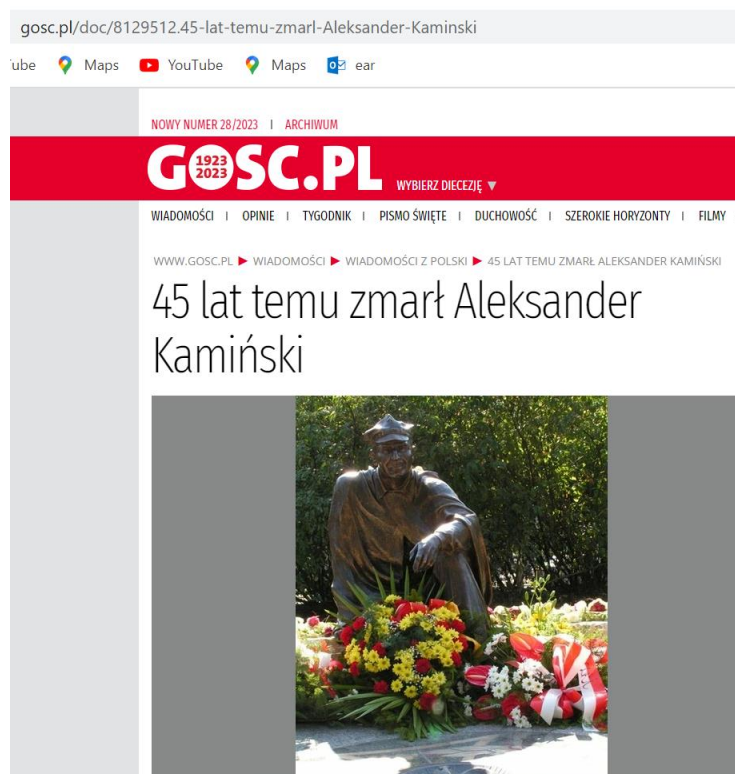
Pomnik Aleksandra Kamińskiego w Łodzi.

Na UŁ pracował prof. Aleksander Kamiński – autor „Kamieni na szaniec” – w 1949r. jego i Jej katedrę zlikwidowano – na 13 lat musieli odejść z uczelni, potem wrócili, a On był Jej szefem, z kolei gdy odszedł na emeryturę – Ona objęła kierownictwo Katedry.