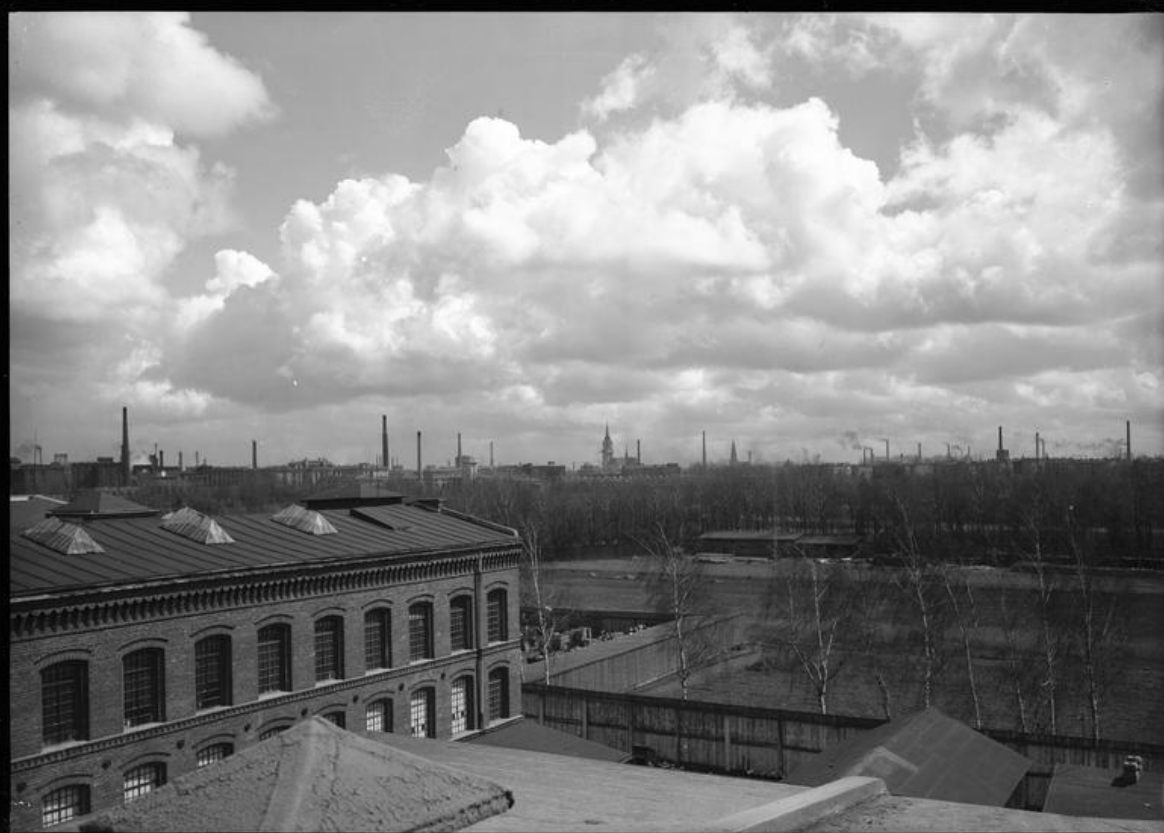
Narodowe Archiwum Cyfrowe