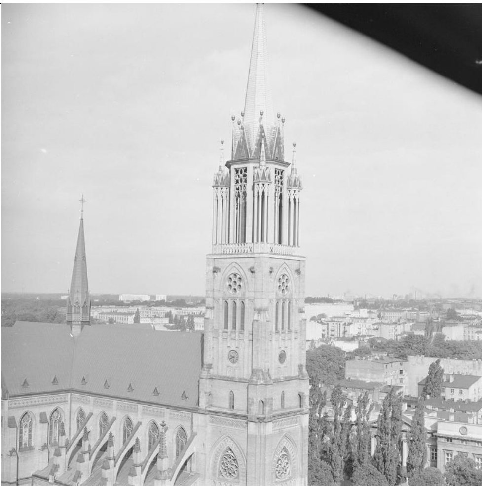
Narodowe Archiwum Cyfrowe