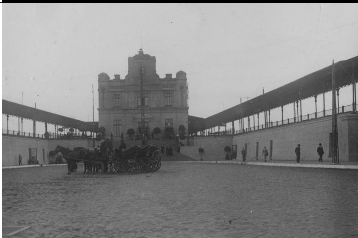
Narodowe Archiwum Cyfrowe