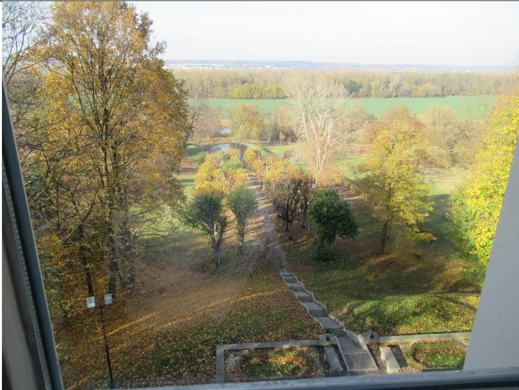
Widok z okna Pałacu na okolicę – dolina rzeki Wisły