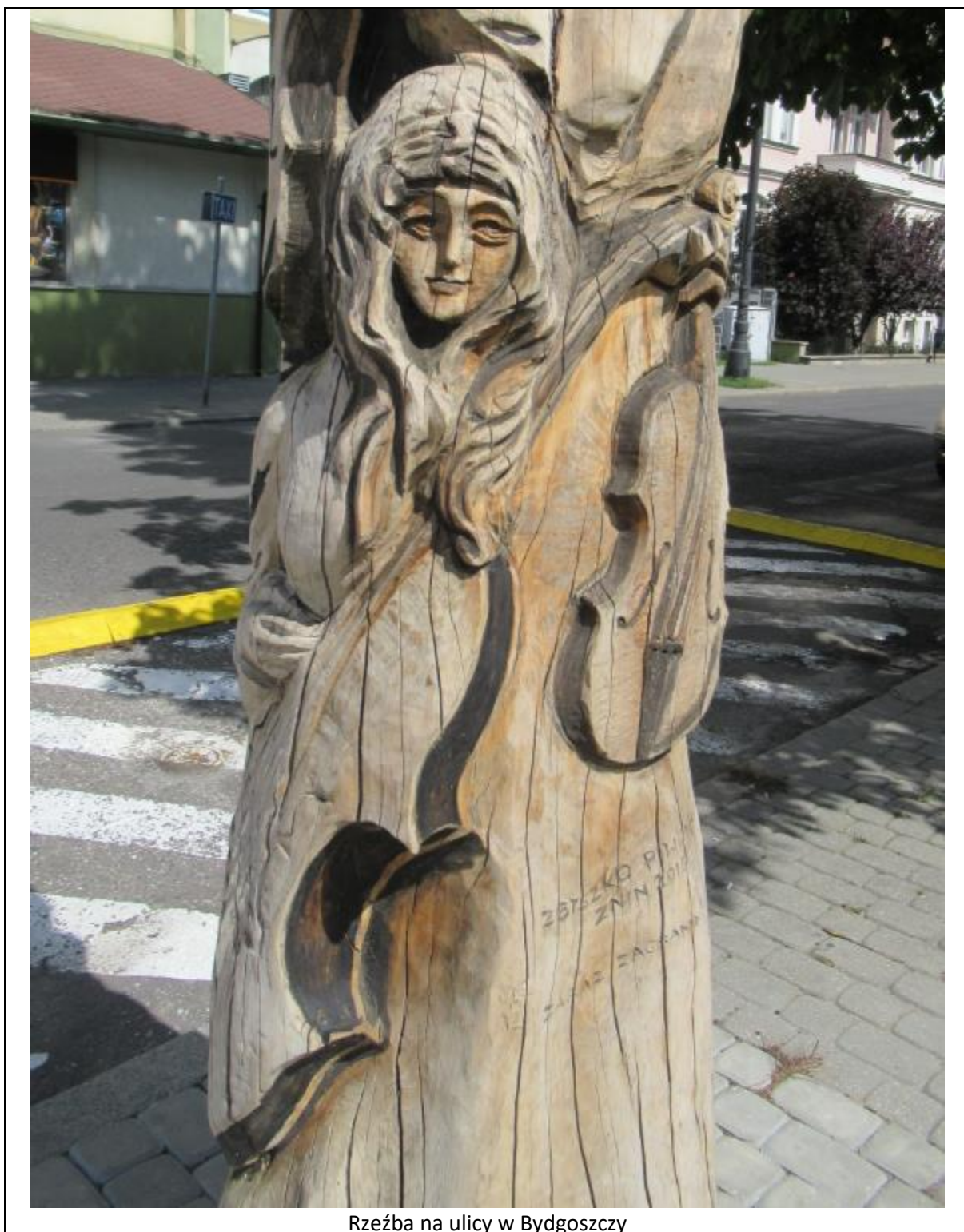
Rzeźba na ulicy w Bydgoszczy