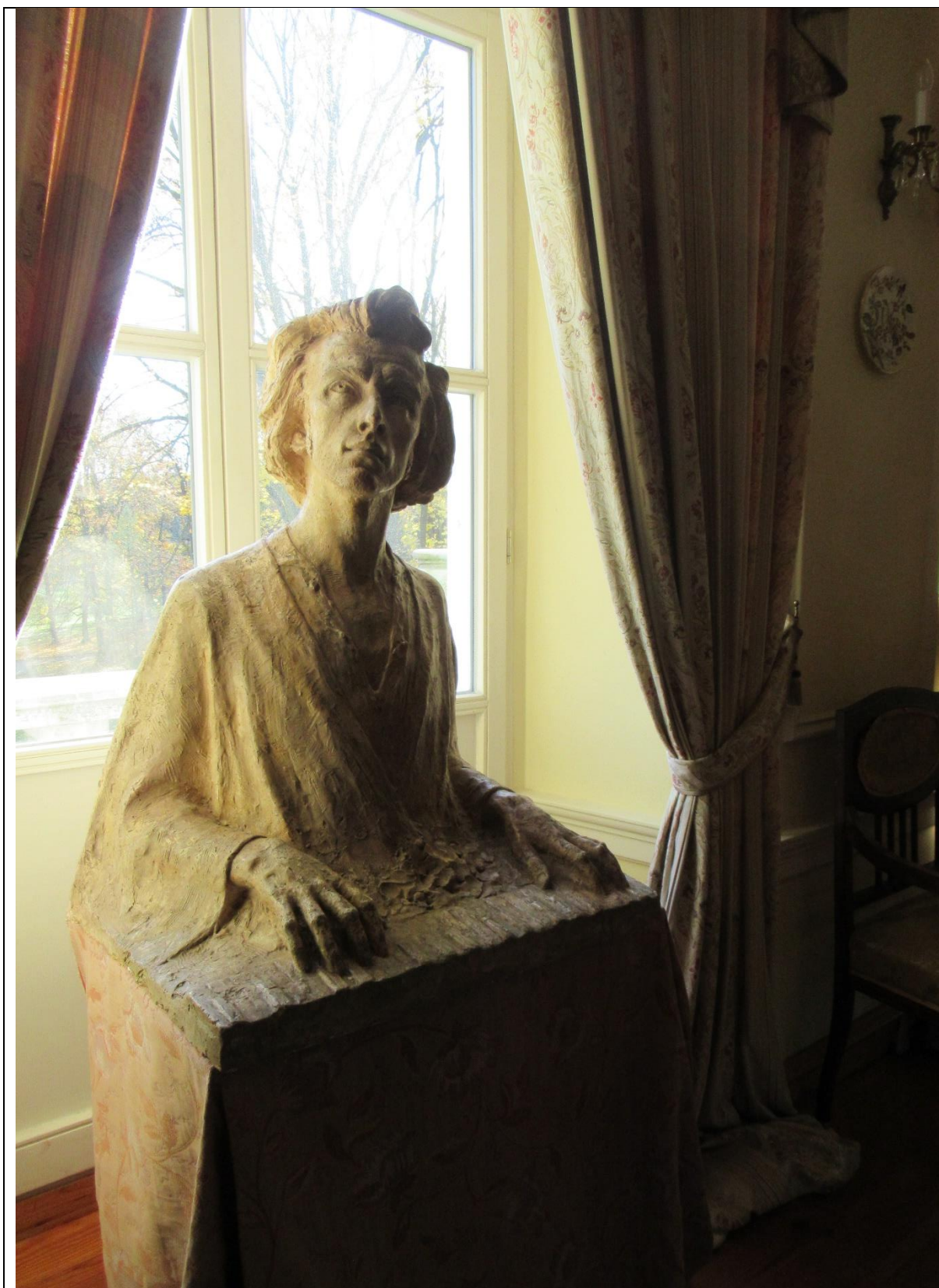
Chopin bywał w okolicach Bydgoszczy i Torunia m.in. w Szafarnii