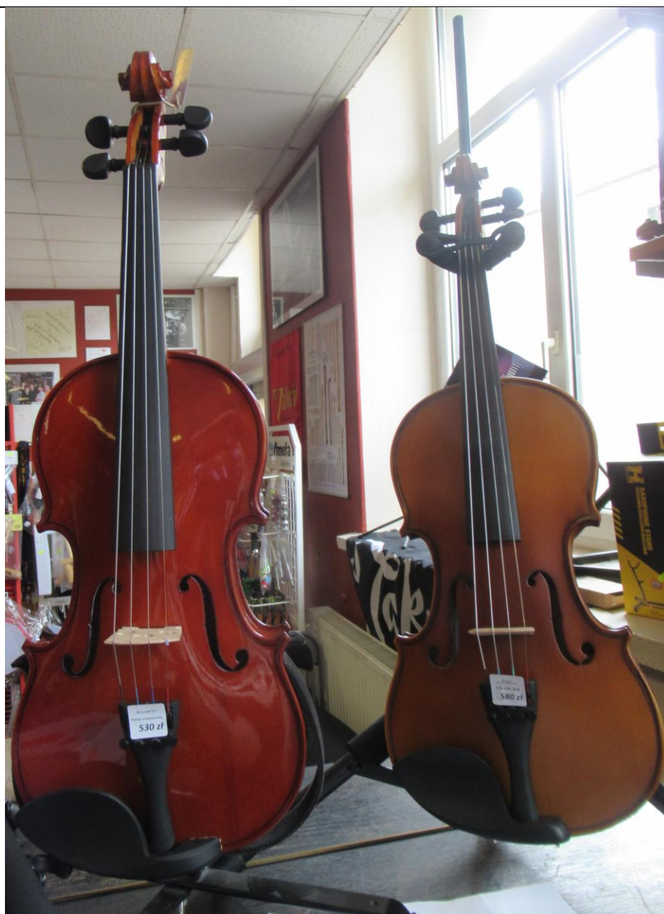
Instrumenty smyczkowe w Salonie Muzycznym ELPA w Bielsku-Białej.