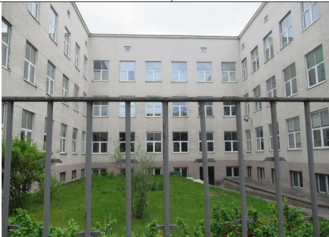
Widok dzisiejszych budynków Wydziału Chemicznego UW od strony ul. Pasteura.