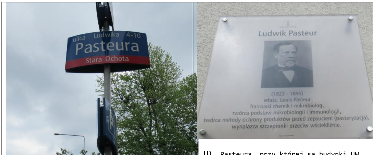
Ul. Pasteura, przy której są budynki UW.