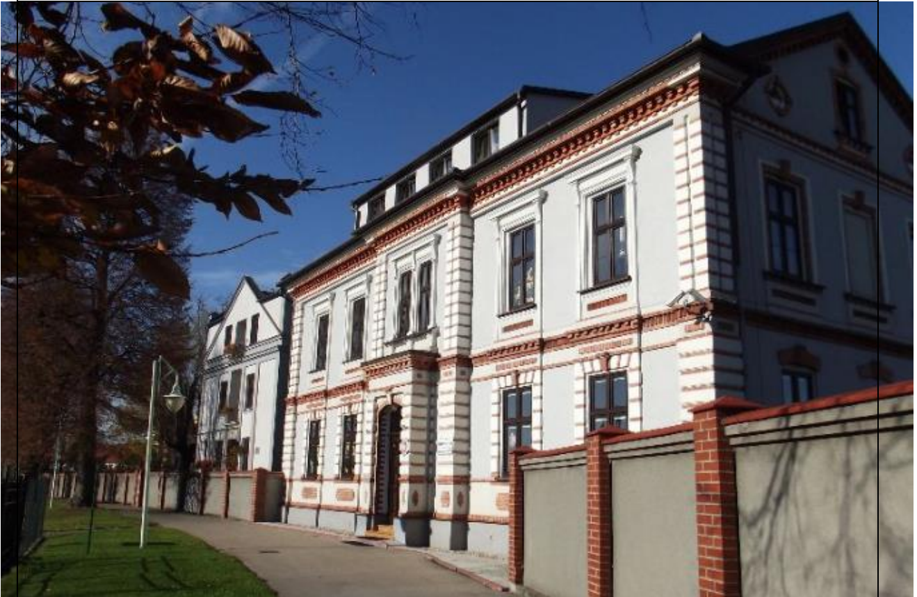
Klasztor Sióstr Zmartwychwstania Pańskiego w Kętach

- słynne miasto w okolicach Bielska-Białej