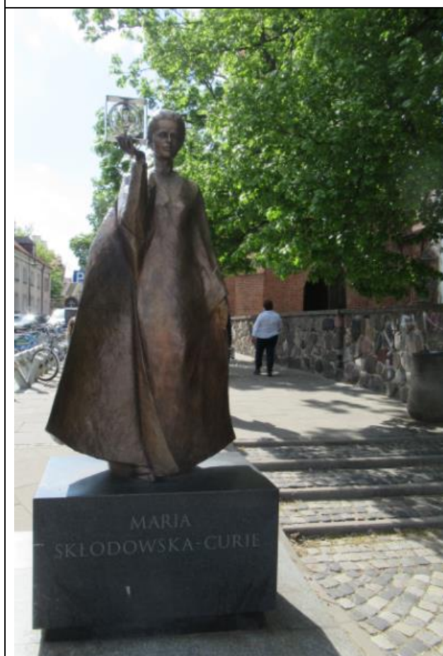
Pomnik Marii Skłodowskiej – Curie, przy murze kościelnym, uczona idzie na skarpe, już widać Wisłę ...