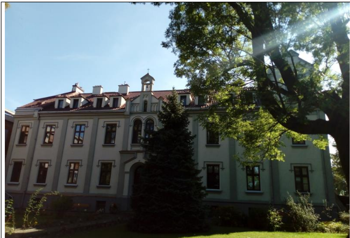
Fotografie z Archiwum Zgromadzenia Sióstr Zmartwychwstanków w Kętach (poniżej)