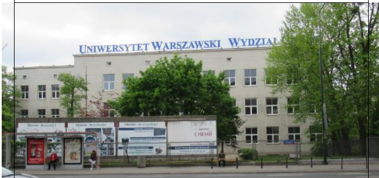
Ten sam budynek Wydziału Chemii UW, formalnie odrębny wydział chemii powstał później...