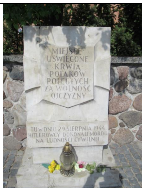
Pomnik przy murze kościelnym.