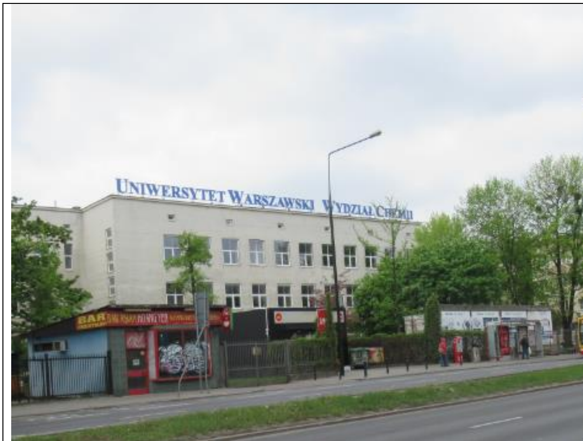
Dzisiejszy Wydział Chemii UW, który to kierunek ukończyła nasza Bohaterka. Poniżej wyraz „CHEMII” ukrył się za drzewami...