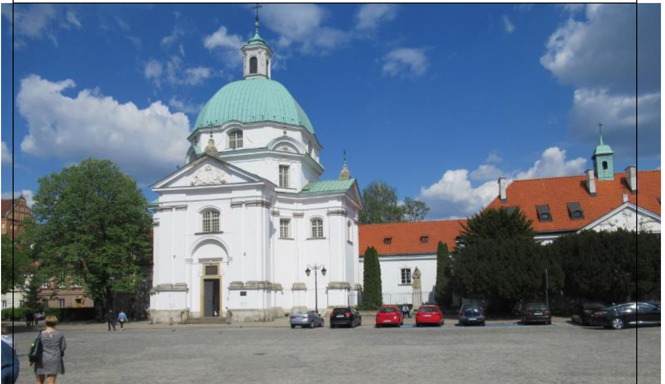
Kościół Nawiedzenia NMP ledwo widoczny w lewym górnym rogu dolnego zdjęcia, na zdjęciu widzimy inny kościół należący do tej samej parafii.