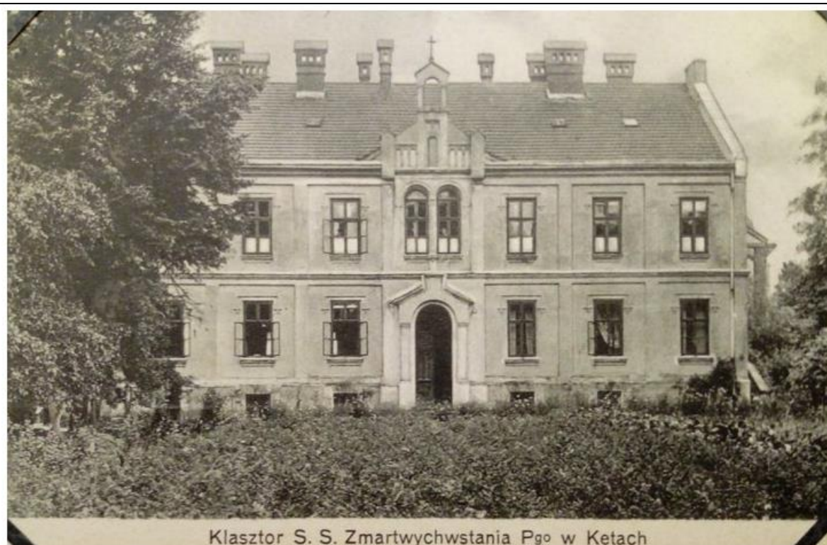
Klasztor S. S. Zmartwychwstania P go w Kętach