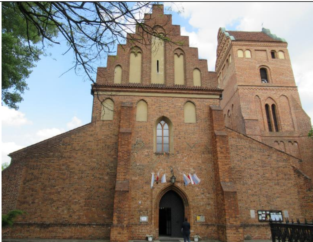
Kościół w Warszawie (na skarpie wiślanej) - Nawiedzenia NMP, w którym Bohaterka była ochrzczona