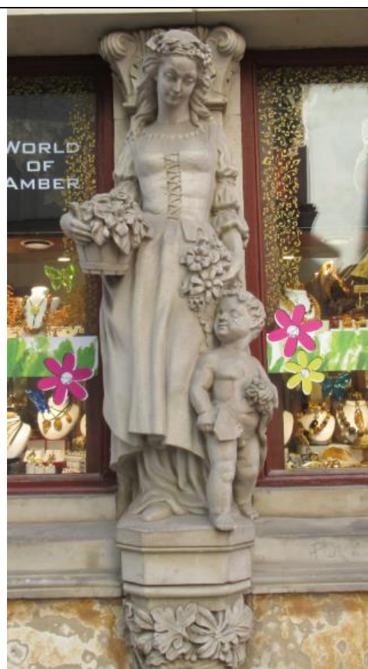
Płaskorzeźba na jednej z kamienic.