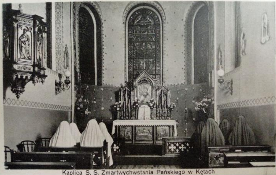
Kaplica S. S. Zmartwychwstania Pańskiego w Kętach