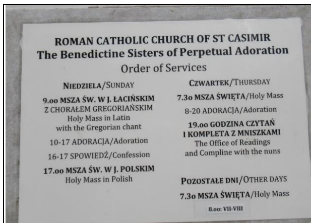
Kościół Sióstr Benedyktynek, przyklasztorny.