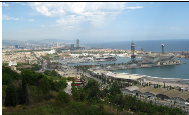
Panorama Barcelony - różne kierunki