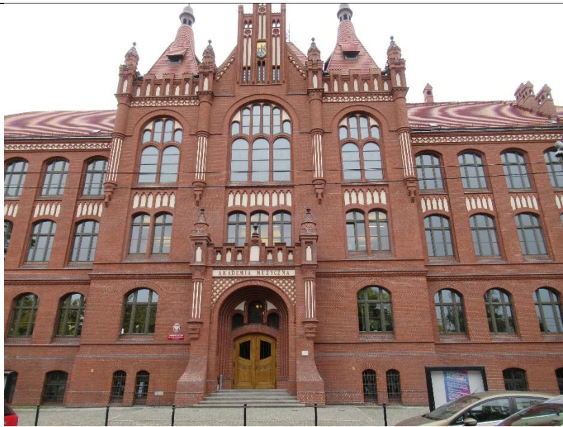
Do starych budynków dobudowano nowoczesne – zachowując kolor cegły – genialne!!!!