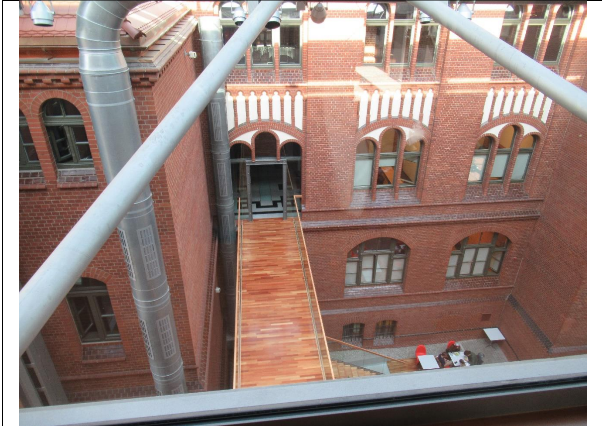
Budynki Akademii Muzycznej w Katowicach to prawdziwe arcydzieło architektury