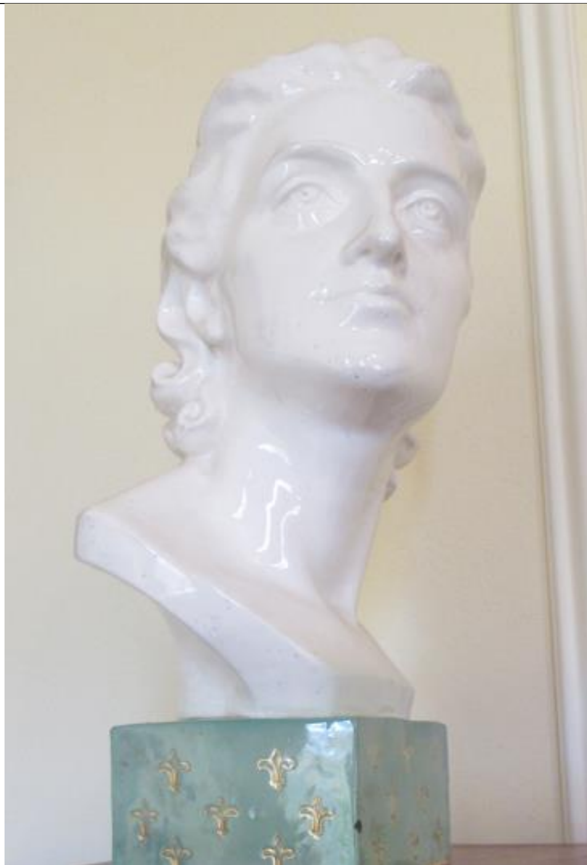
Rzeźba – Głowa kobiety – Muzeum im. Wyczółkowskiego w Bydgoszczy