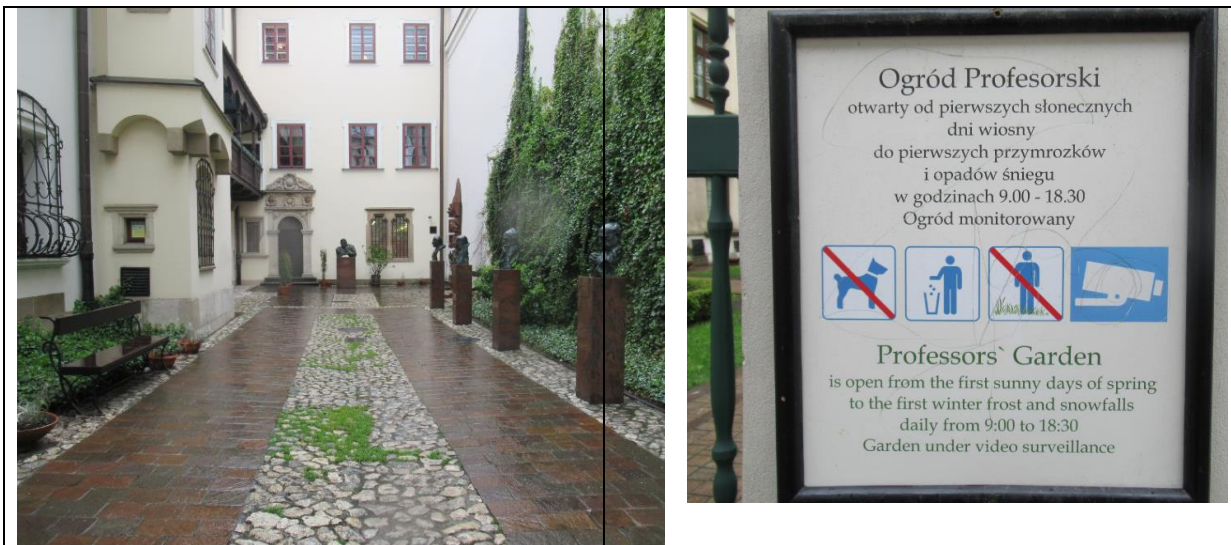
Dziedziniec z popiersiami wybitnych profesorów