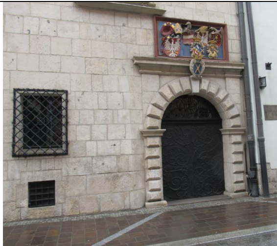
Jedna z bram do Collegium Maius