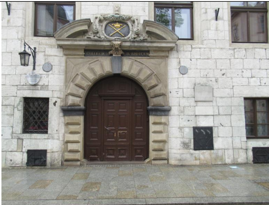
Jeden z historycznych budynków Wydziału Prawa UJ