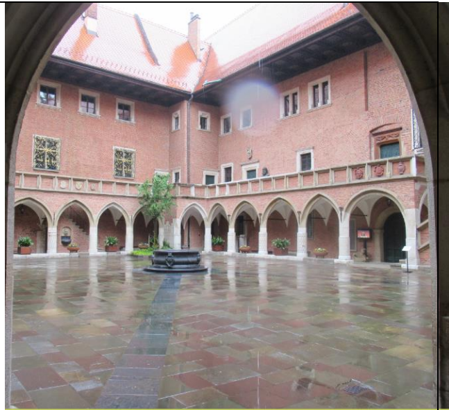
Dzień był deszczowy – mokry dziedziniec Uniwersytetu