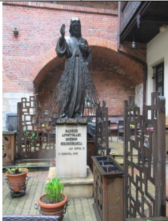
Rzeźba na dziedzińcu obok kościoła, wzorowana na obrazie „Jezu ufam Tobie”