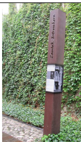
Na słupie napis: Zaulek Estreichera /wybitnego profesora z znanej krakowskiej rodziny/