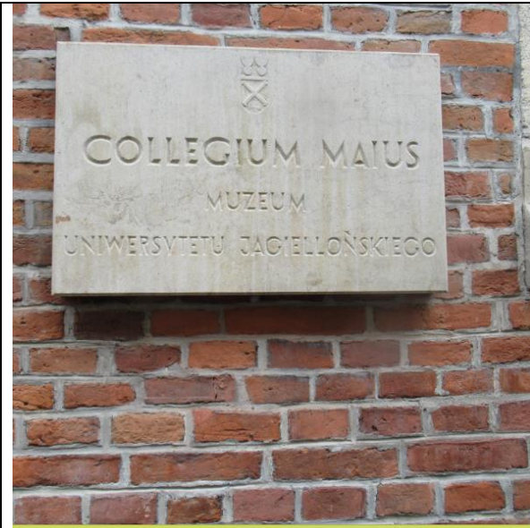
Tablica informująca, że obecnie jest to muzeum