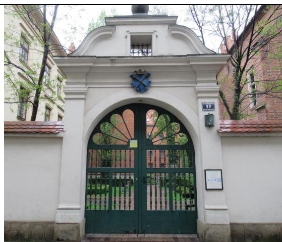
Dziedzińce na Uniwersytecie