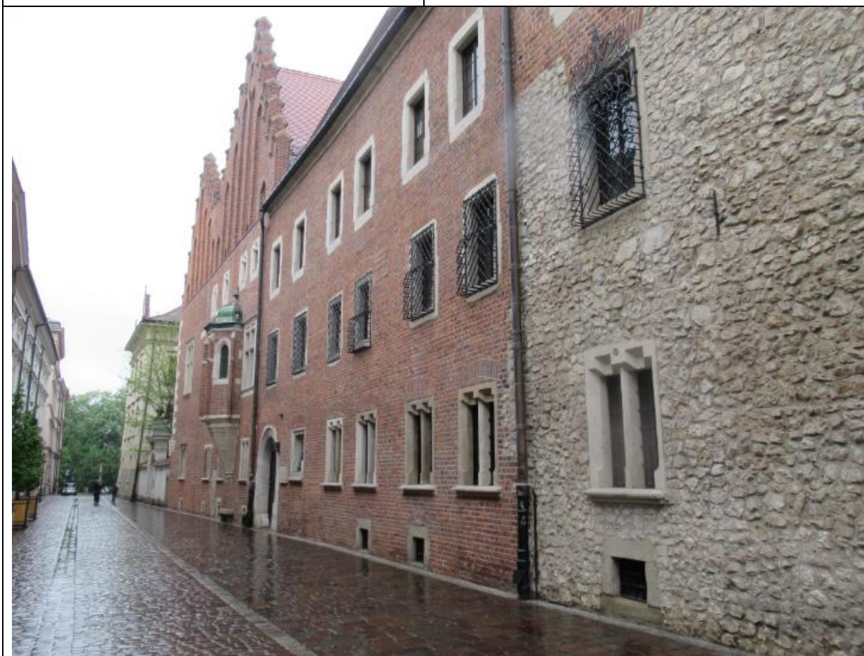
Kolegium Maius – jeden z najstarszych budynków Uniwersytetu