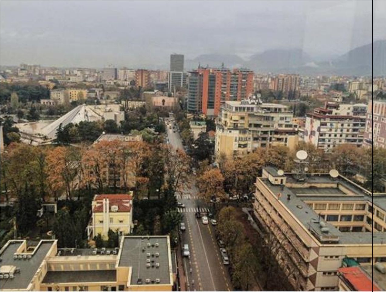
Tirana – stolica Albanii