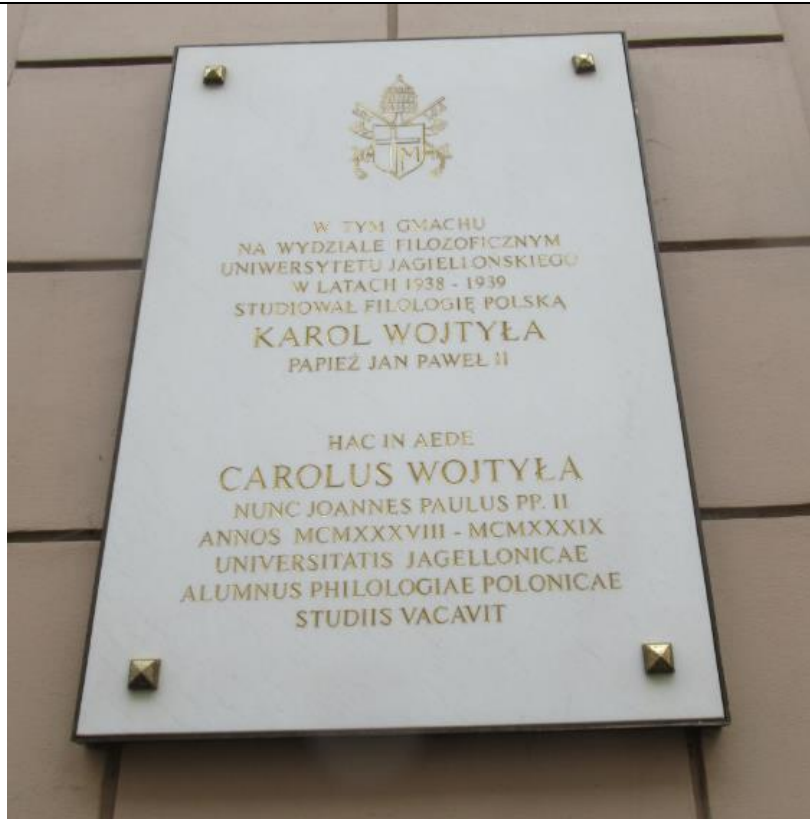
Tablica pamiątkowa informująca, że na UJ studiował Karol Wojtyła – późniejszy Papież, który dokonał aktu Beatyfikacji naszej Bohaterki