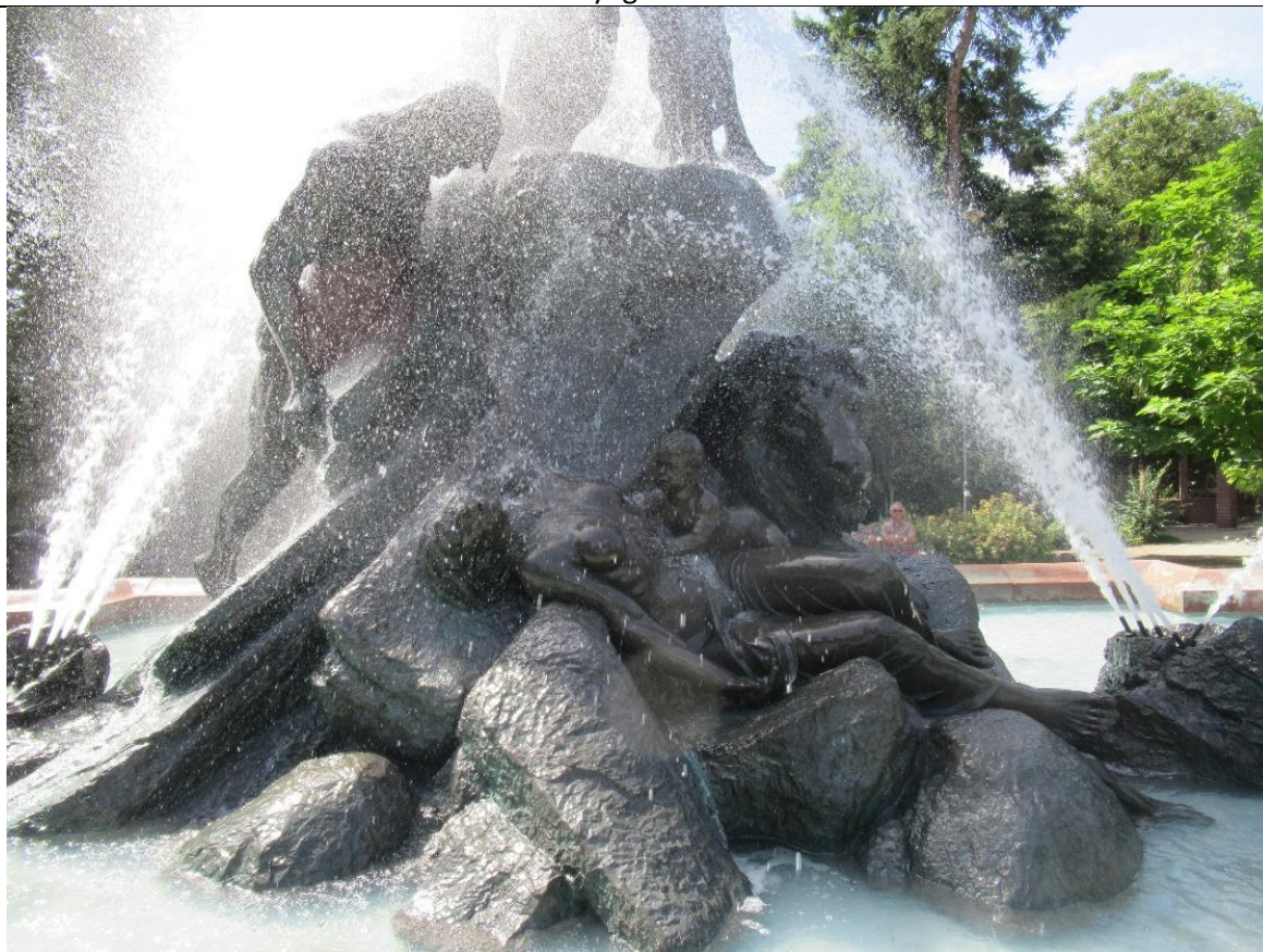
Rzeźba „Potop” w Parku w centrum Bydgoszczy