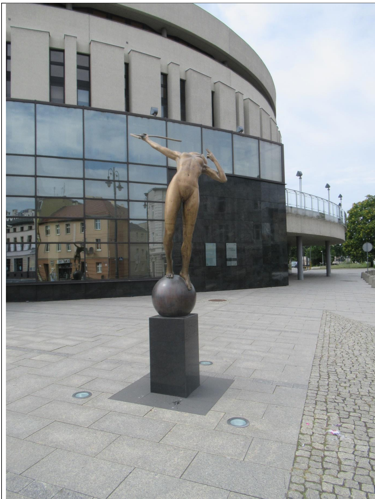
Pomnik ŁUCZNICZKI /NR 2/ – IKONY BYDGOSZCZY przed Operą Nową (jest jeszcze druga Łuczniczka koło Teatru Polskiego w Bydgoszczy)