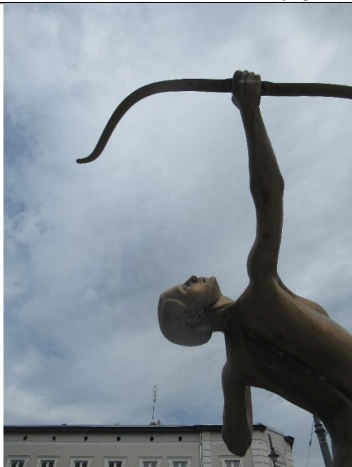
Bydgoszcz – okolice OPERY