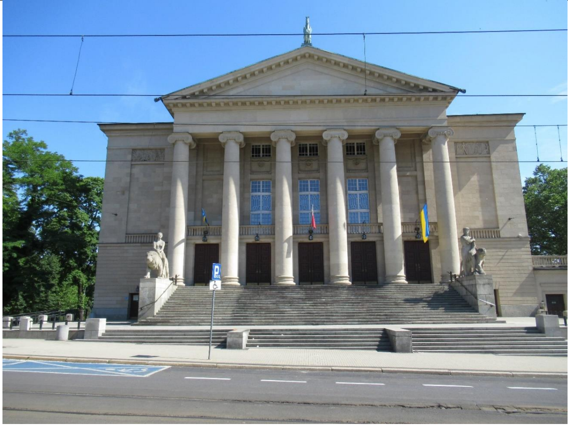
Opera w Poznaniu