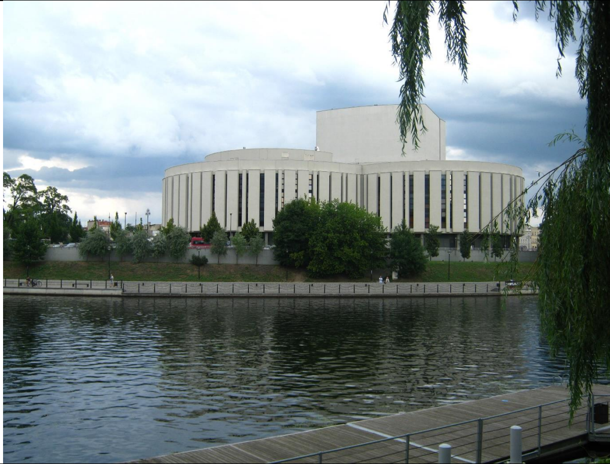
Opera Nova w Bydgoszczy