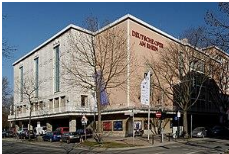
Opernhaus Düsseldorf (2011)