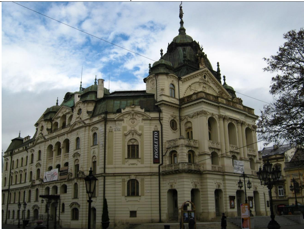
Opera w Koszycach