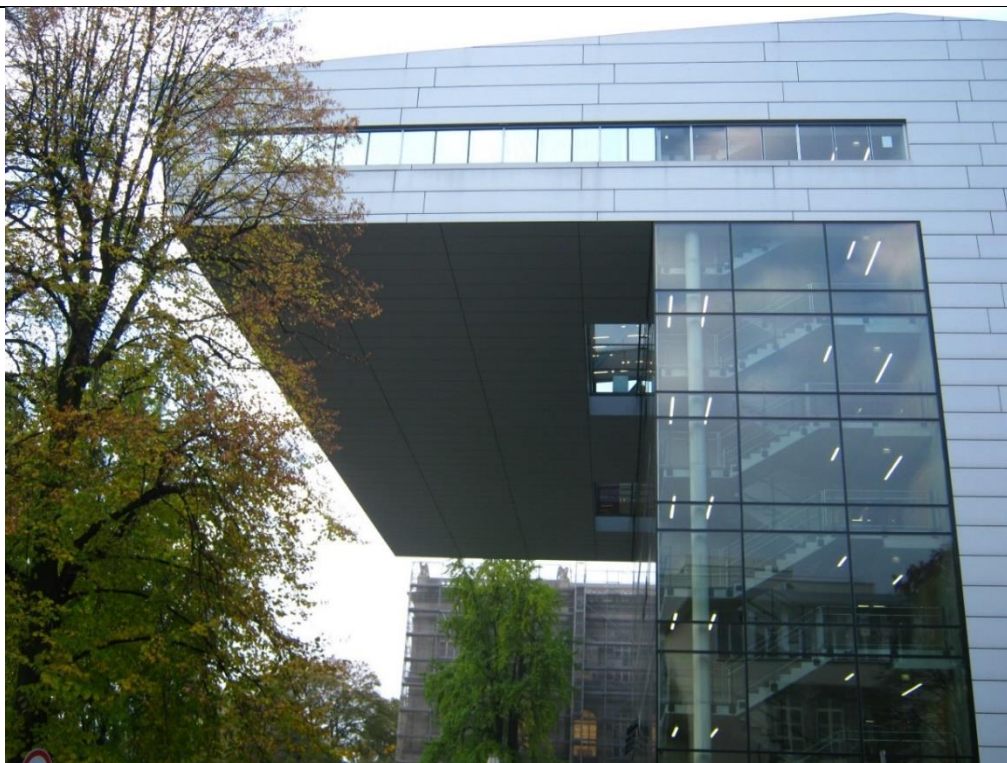
W tym budynku eseista był dwa razy – na międzynarodowych konferencjach naukowych