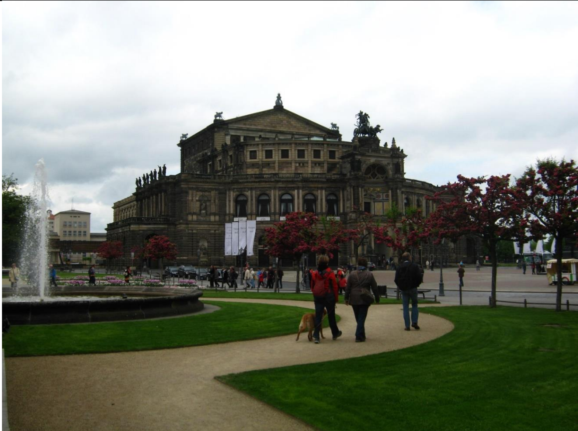
"Semper Oper" w Dreźnie