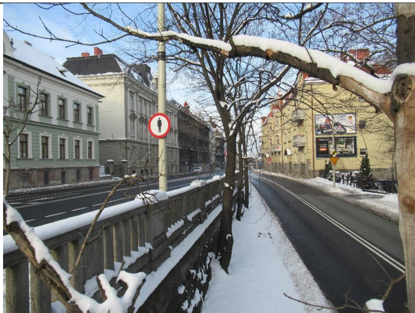
Dzisiejszy wygląd miejsc na trasie, po której kroczył pochód żydowskich harcerzy!