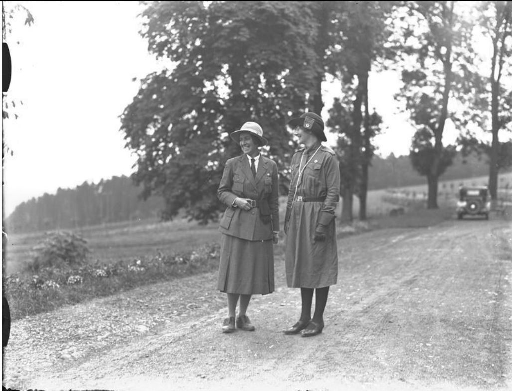
Narodowe Archiwum Cyfrowe