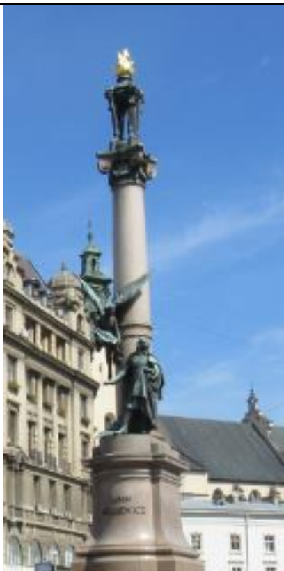
Pomnik we Lwowie