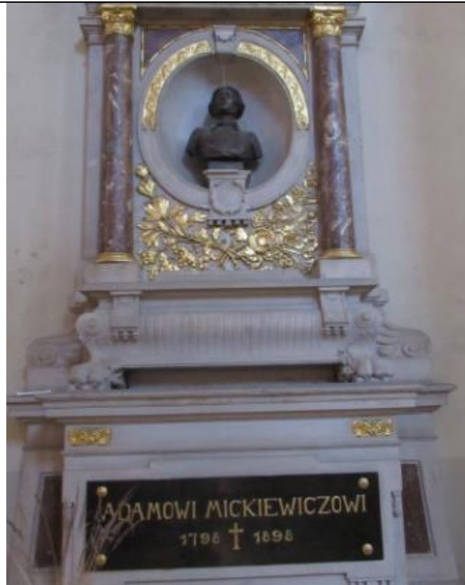
W kościele Uniwersyteckim w Wilnie – tablica pamiątkowe – ta i poprzednia