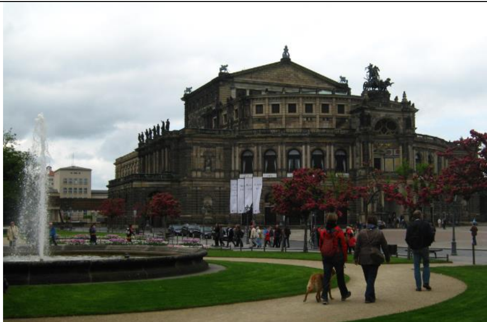
Opera w Dreźnie „Semperoper” (1838-1845) – eseista był 2 razy na operach: Aida oraz Tosca