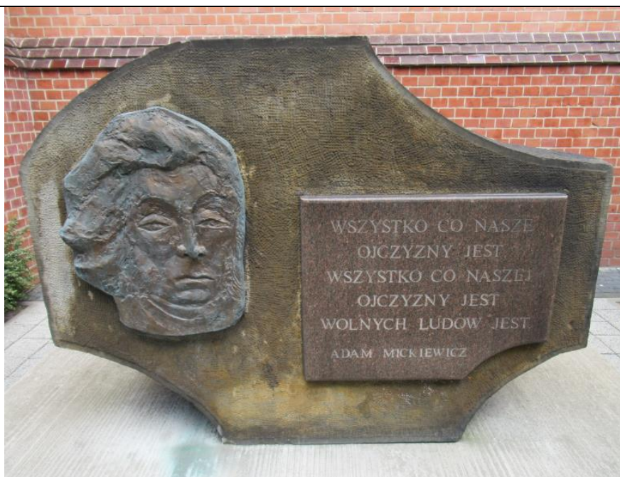
Tablica przed Liceum im. Mickiewicza w Poznaniu