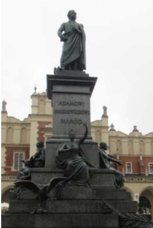
Pomnik Wieszczka na Rynku w Krakowie