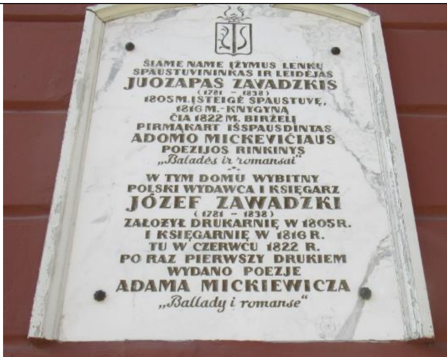
Tablica pamiątkowa na domu w Wilnie, gdzie wydano drukiem „Ballady i Romanse”