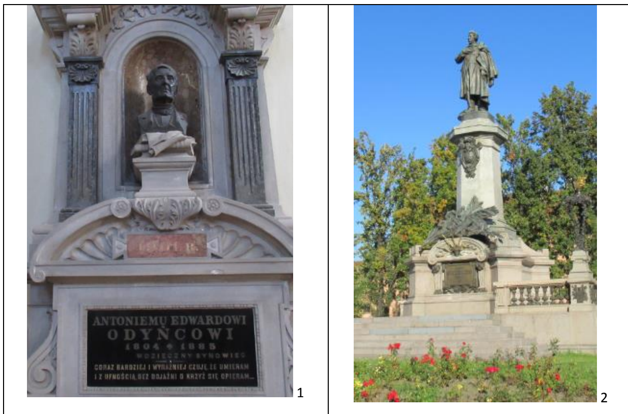
Tablica dla Antoniego Edwarda Odyńca – z bratniego Towarzystwa Filaretów 8 (1); Pomnik Adama Mickiewicza w Warszawie (2)