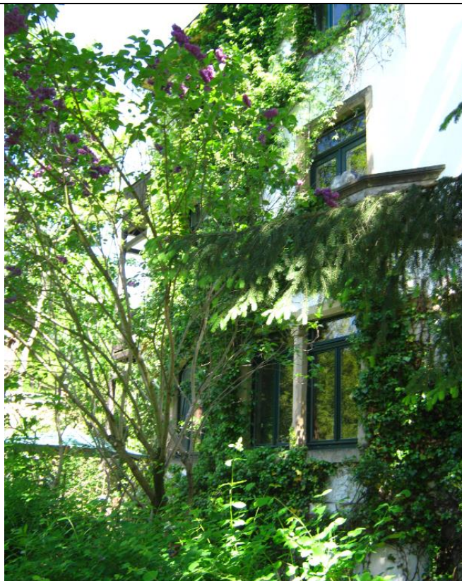
Dworek Kraszewskiego w Dreźnie - dziś małe muzeum

Pałac w Rogalinie, gdzie w 1832 roku krótko przebywał Adam Mickiewicz 9