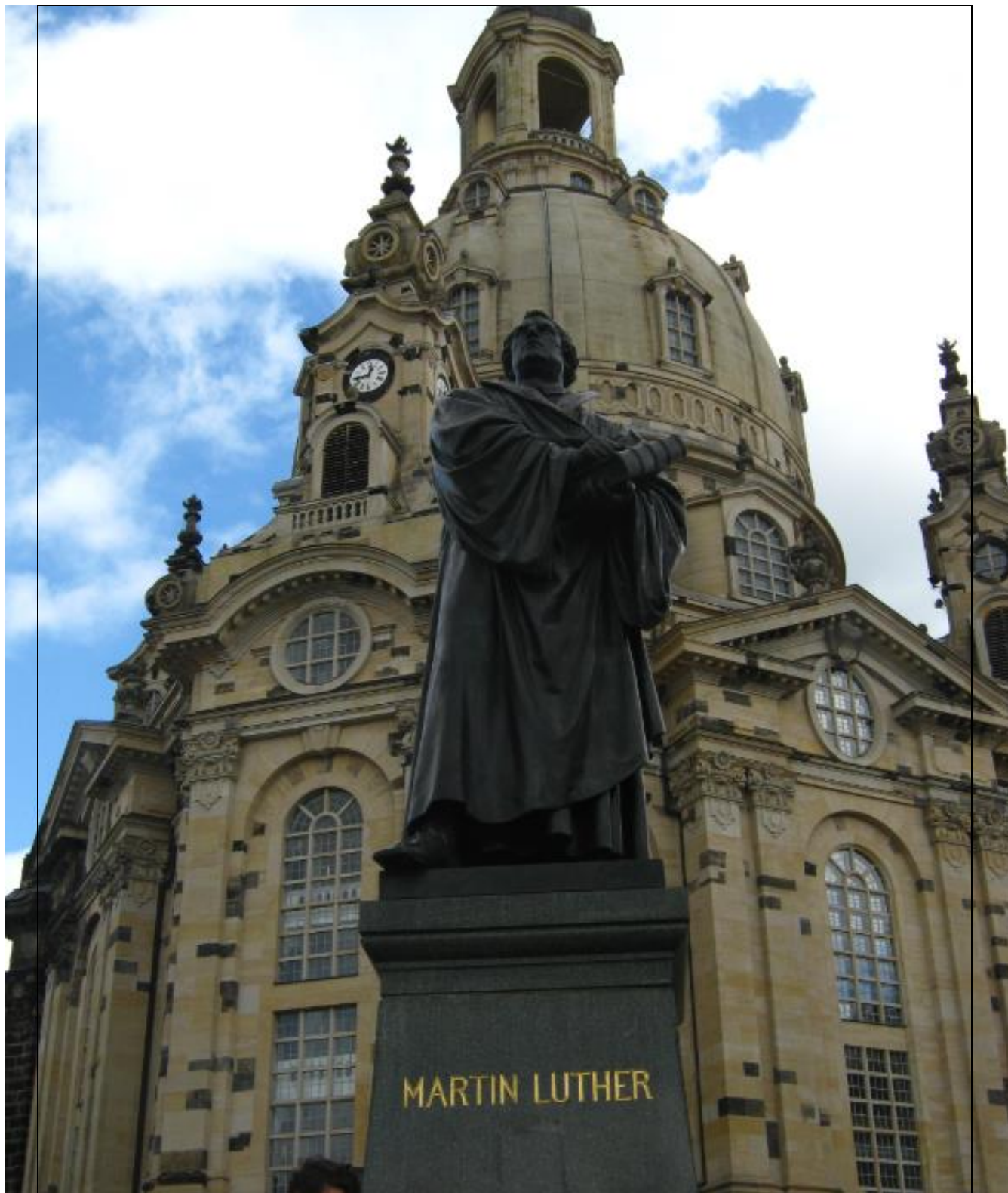
Pomnik Marcina Lutra – przed Frauenkirche, który był całkowicie zniszczony po II wojnie światowej, obecnie odbudowany z kawałkami starych kamieni oraz z nowoczesnym wzmocnieniem konstrukcji.