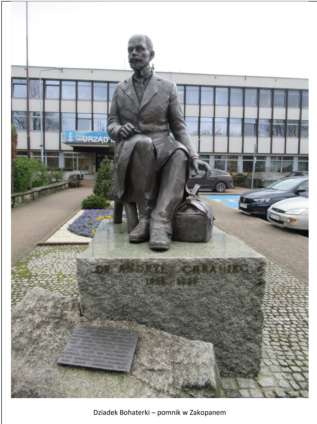
Dziadek Bohaterki – pomnik w Zakopanem