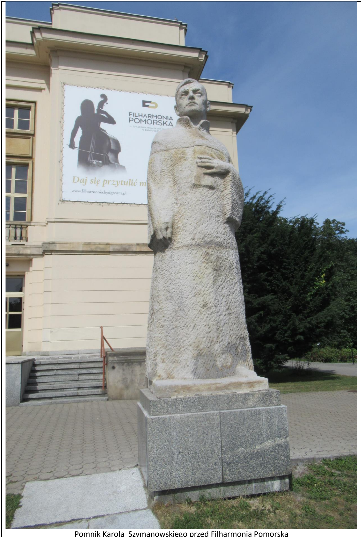
Pomnik Karola Szymanowskiego przed Filharmonią Pomorską