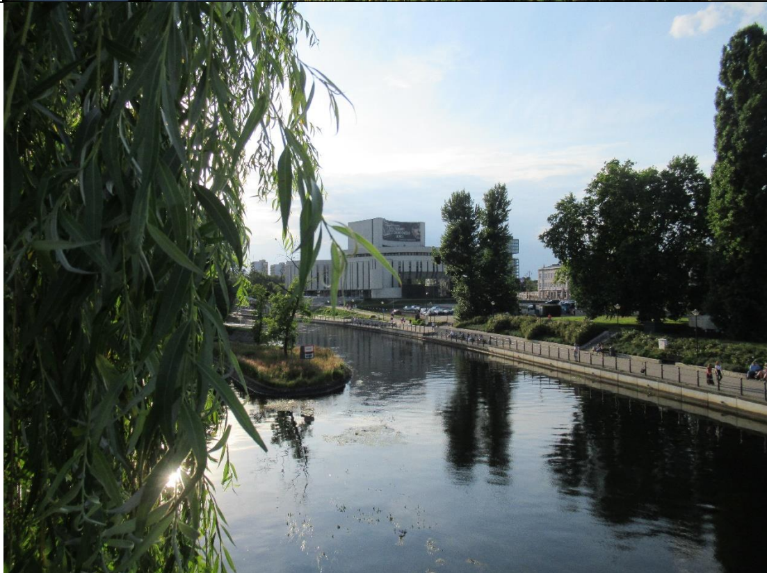
Opera nad rzeką Brdą