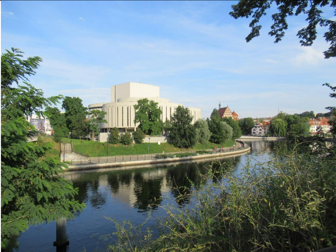
Bydgoszcz – miasto eseisty - tu koncertowała nasza HEROINA