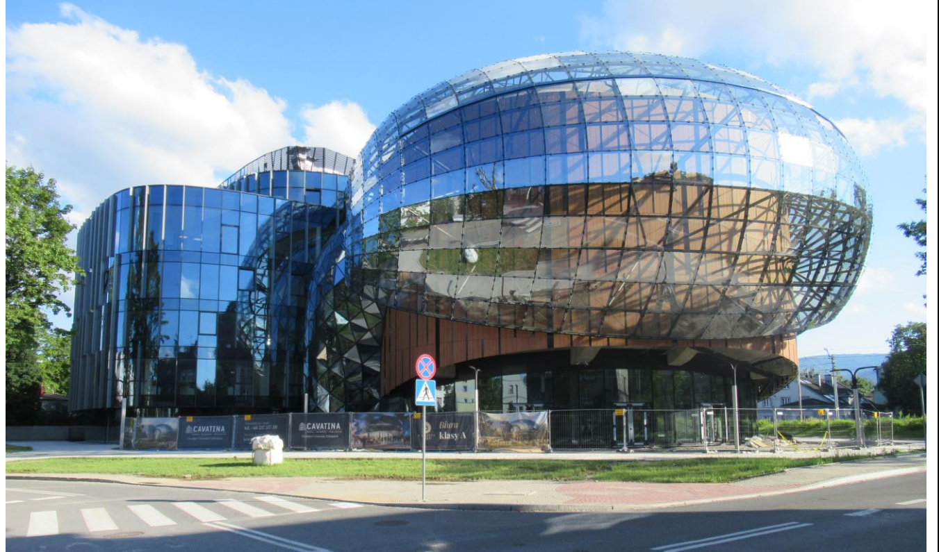
Miłośnicy muzyki z Bielska-Białej czekają na pierwszy koncert w tej SALI