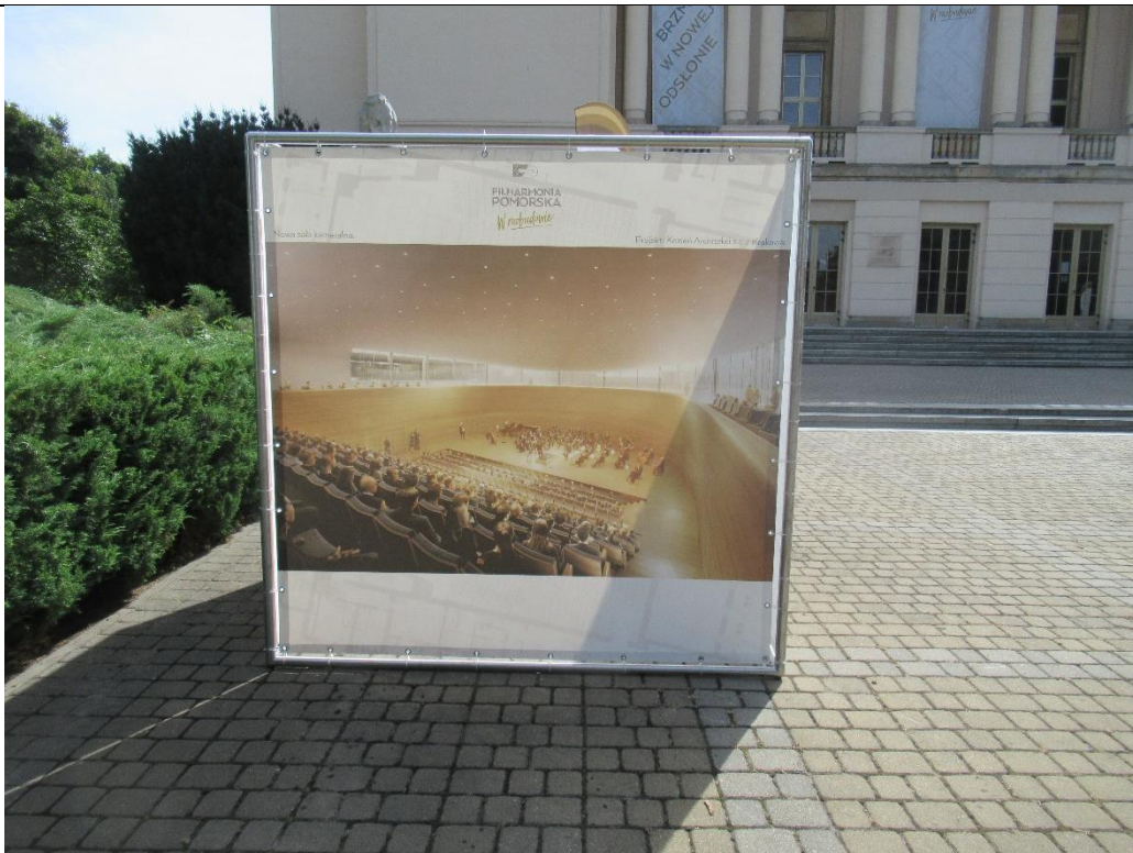
Planowany wygląd Sali Koncertowej po renowacji