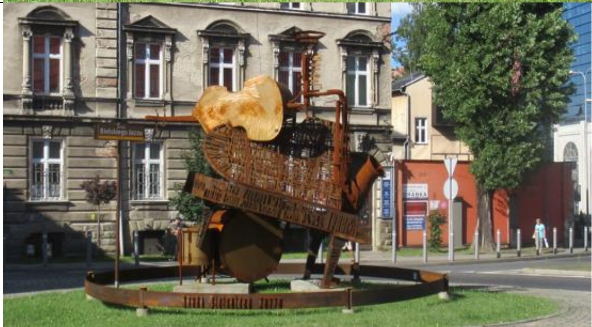
Rondo Bielskiego Jazzu - wydaje się iż jest to unikalne w Polsce