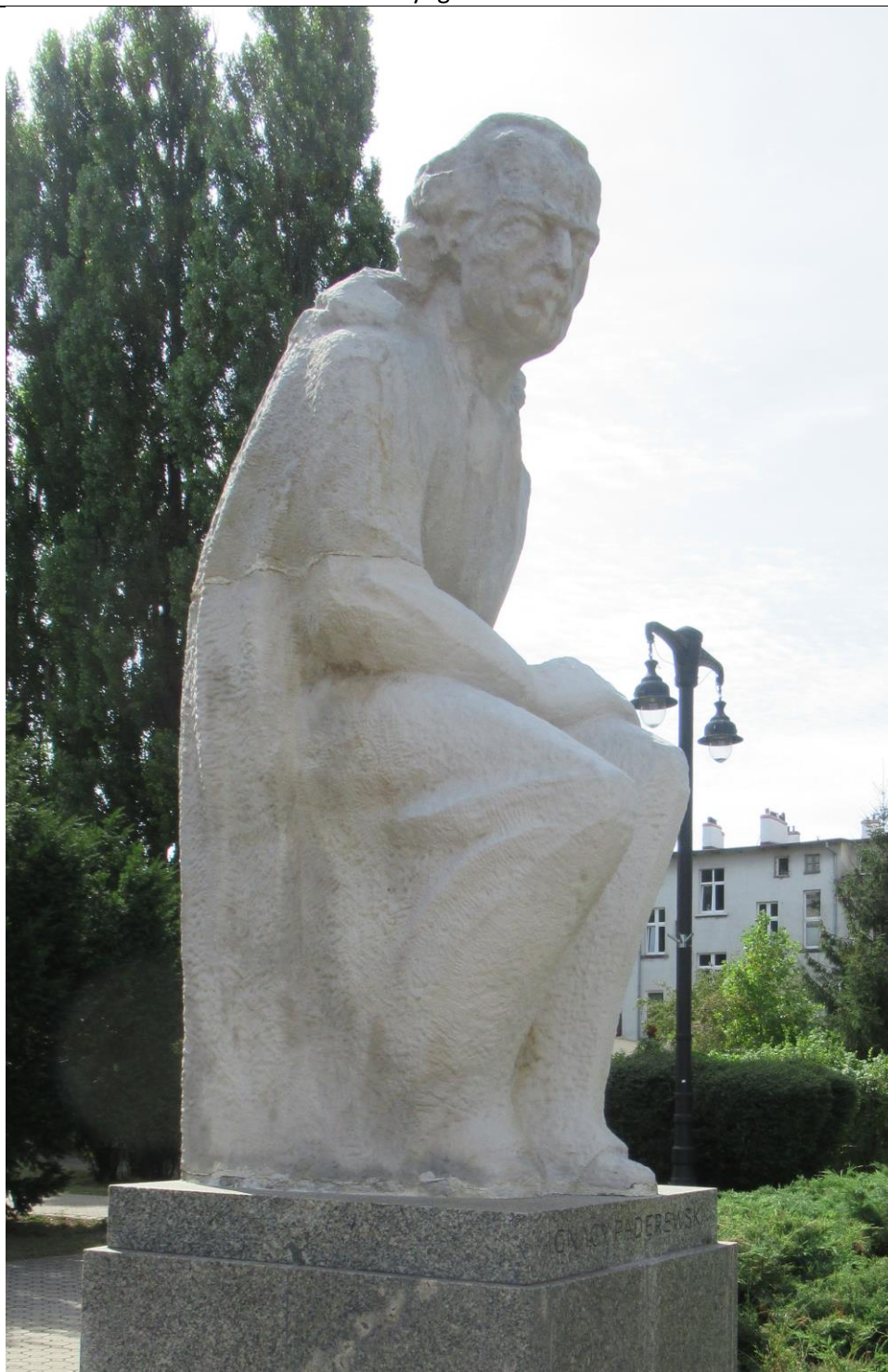
Pomnik Ignacego Jana Paderewskiego – jednego z bojowników o niepodległą, odrodzoną POLSKĘ, słynnego pianisty, premiera RP