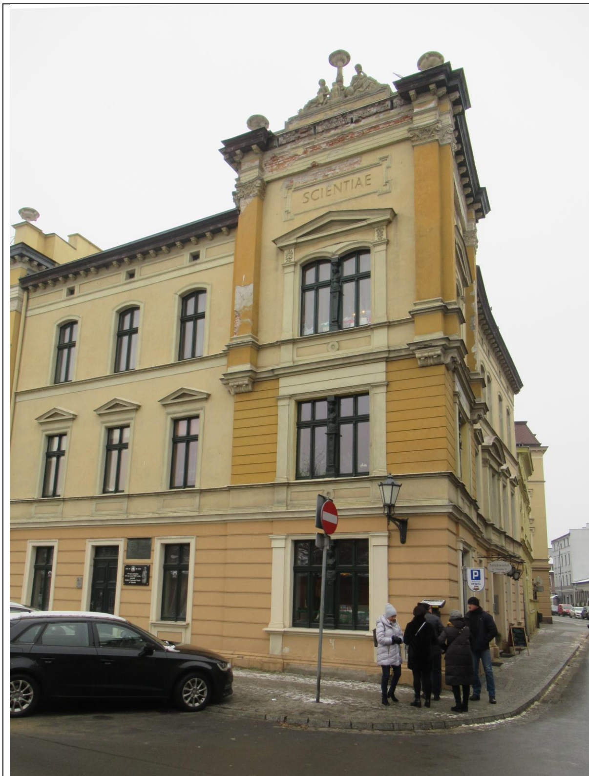
Kamienica, na której umieszczono tablicę o organizacji PCK