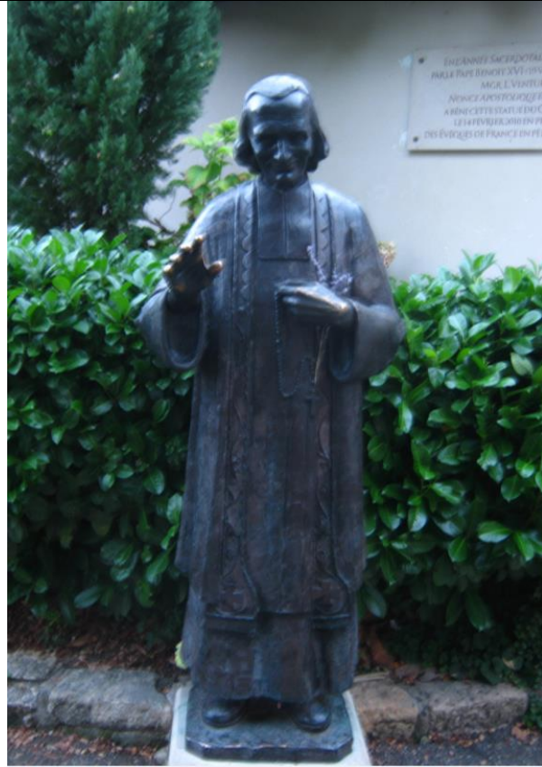
Pomnik Św. Jana – proboszcza z Ars