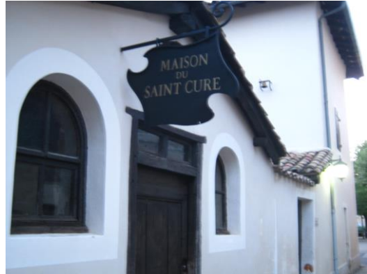
Uliczka w miasteczku, dom proboszcza