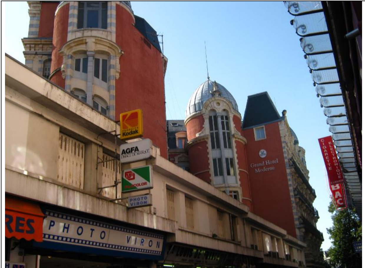
Lourdes – tzw. katolickie Las Vegas; poniżej: widok na zamek górujący nad miastem