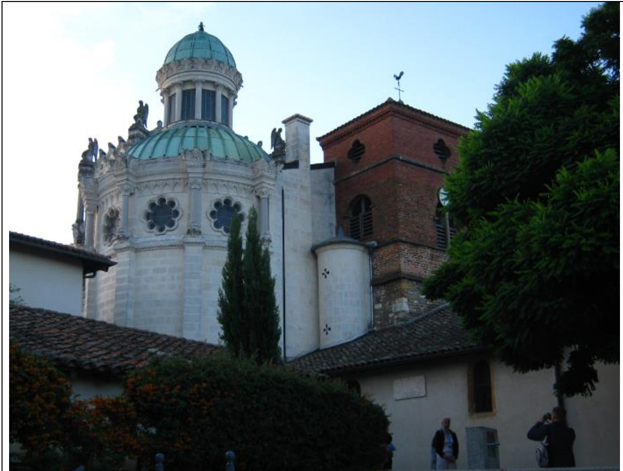
Do sanktuarium przybywają pielgrzymki z Polski...