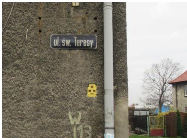
Po lewej widok na fasadę kościoła