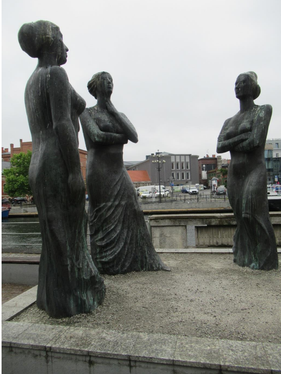
Zdjęcie przy okazji (pomnik kobiet w Bydgoszczy)

Zdjęcia z Katowic, z uczelni UŚ i innych - można znaleźć w naszej serii w esejach o Paniach Profesor związanych ze Śląskiem (57, 66, 71, 72, 78 oraz 108).