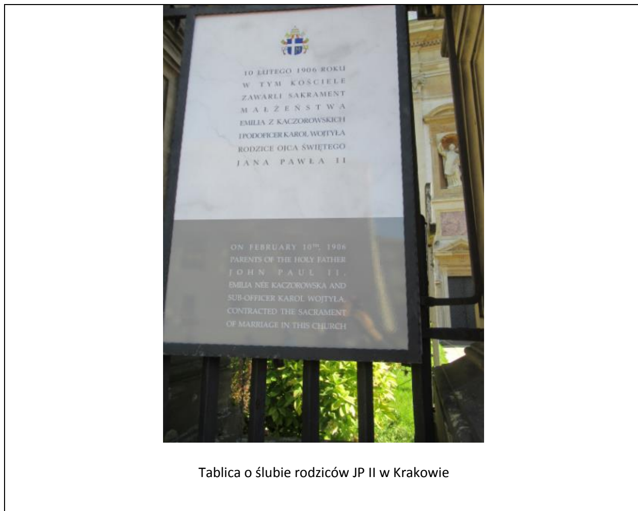
Tablica o ślubie rodziców JP II w Krakowie