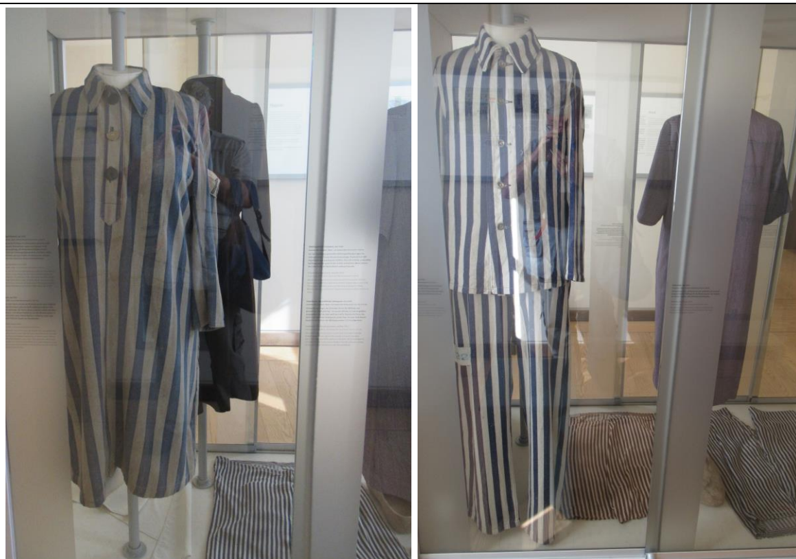
Więzienne stroje kobiet