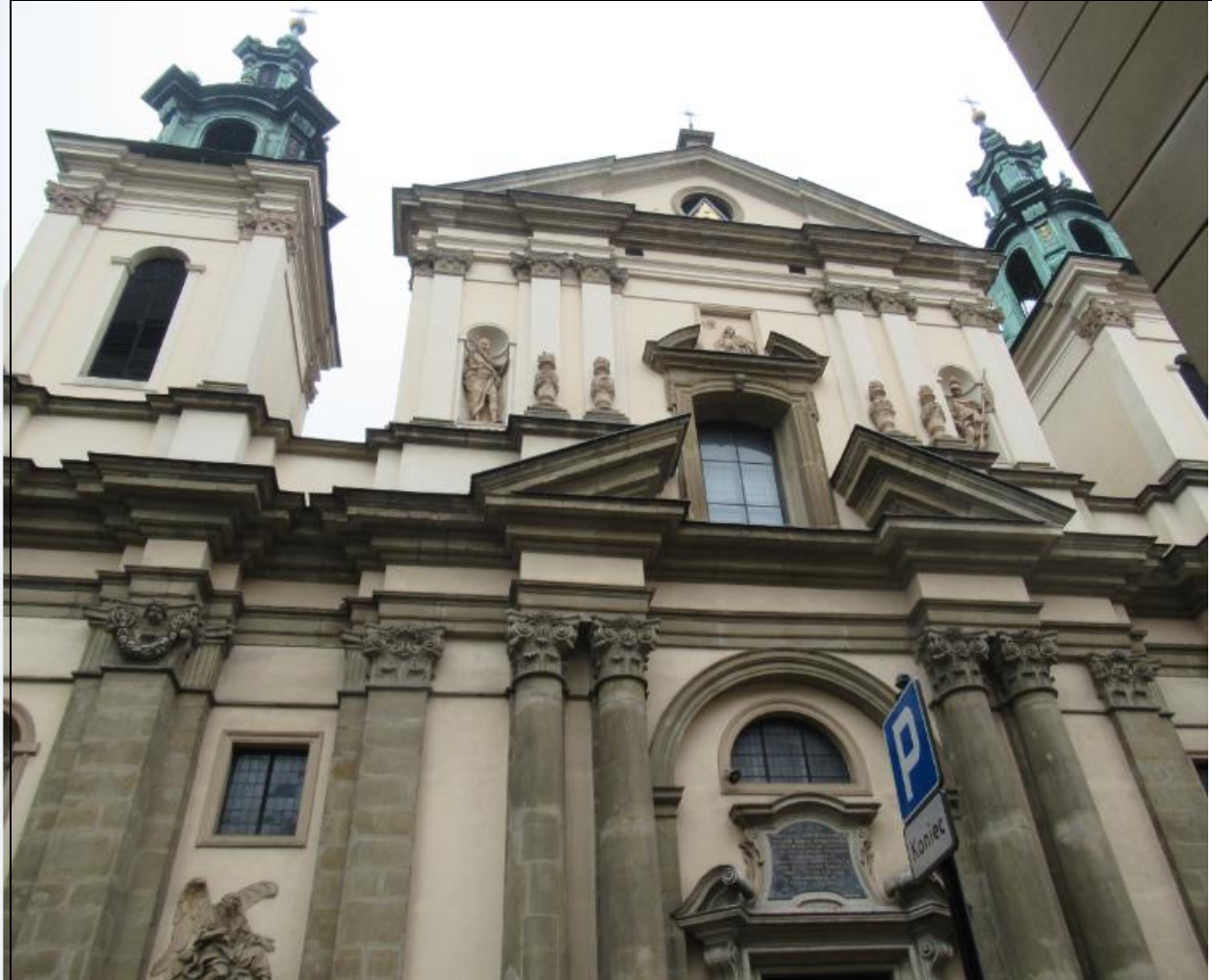
Kościół Św. Anny, wprost naprzeciwko wydziału lekarskiego UJ