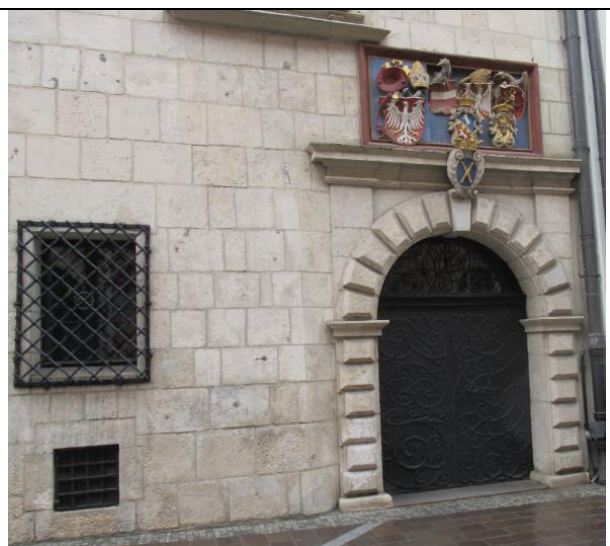
Bramy do budynków Uniwersytetu