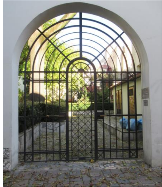
Widok na dziedziniec Wydziału Lekarskiego /po lewej/ brama na dziedzinie innego wydziału