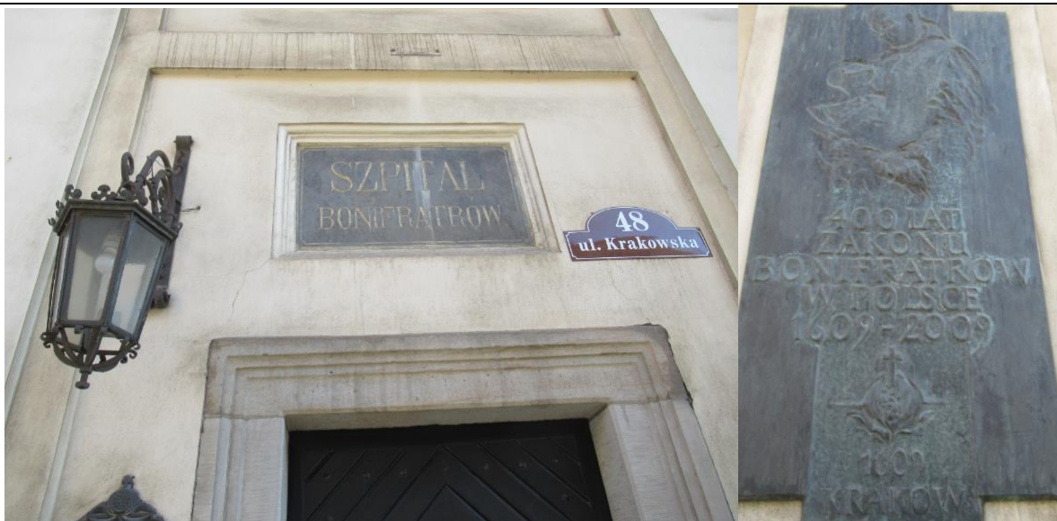
Szpital Bonifratrów w Krakowie /zdjęcie przy okazji/