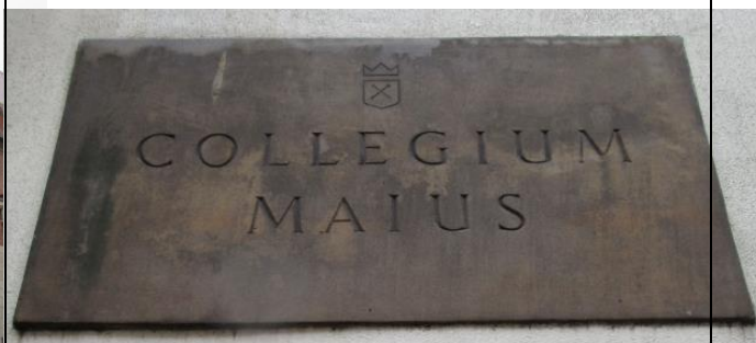
Collegium Maius – dziś muzeum Poniżej budynek Wydziału Filologii