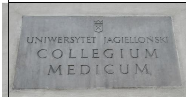
Wydział Lekarski Uniwersytetu Jagiellońskiego