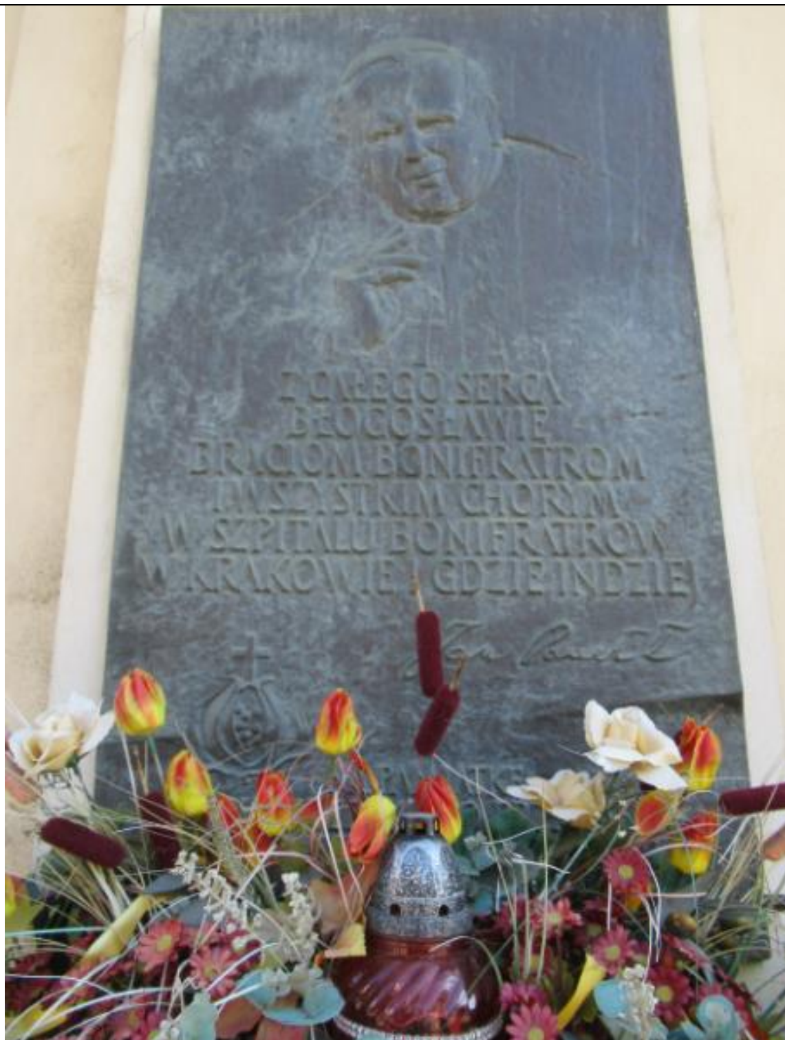
Tablica pamiątkowa dedykowana JP II, jedna z wielu w Krakowie