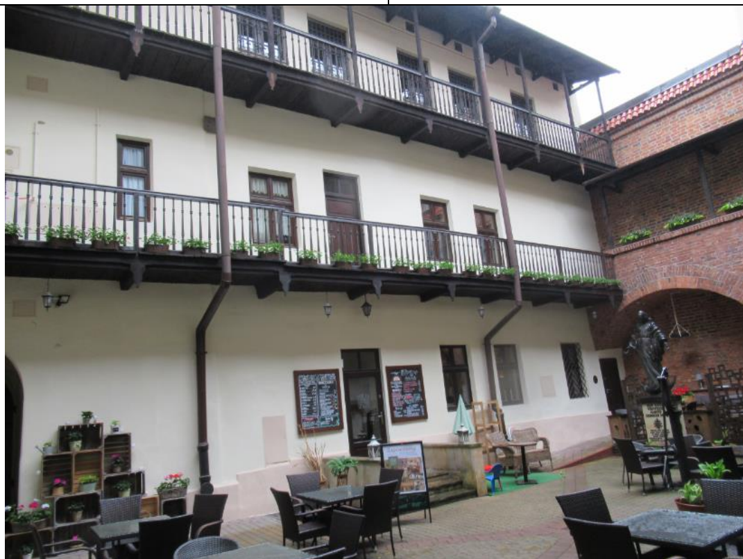
Podwórkó - obok kościoła Św. Anny, z niego wchodzi się do budynku domu parafialnego.