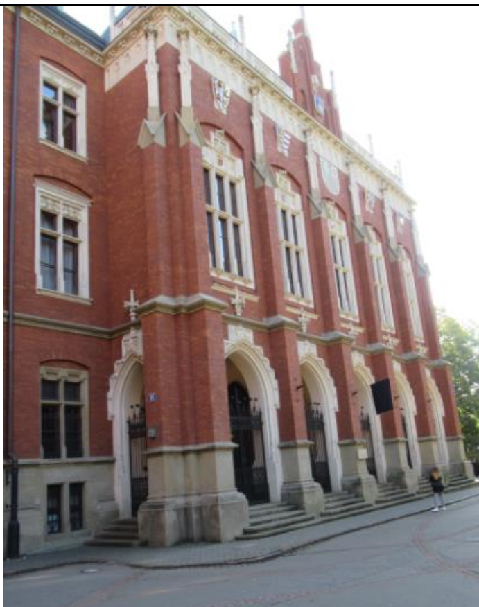
Collegium Novum 9