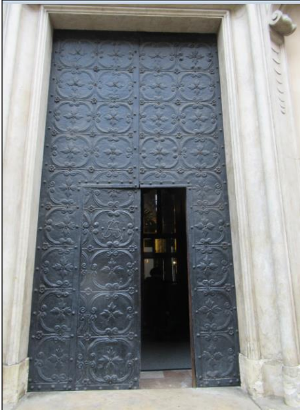
Wejście do kościoła Św. Anny, obok figura na placu