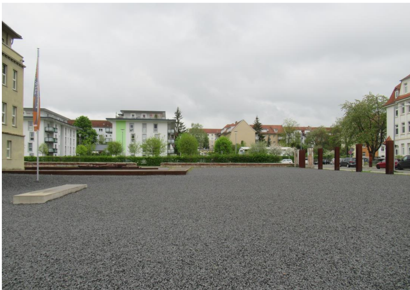
Budynek po prawej – przed nami plac

Muzeum jest dziś w mieście Erfurt, zaznaczono iż nie wolno publikować zdjęć z ekspozycji , a zatem są tylko z zewnątrz.