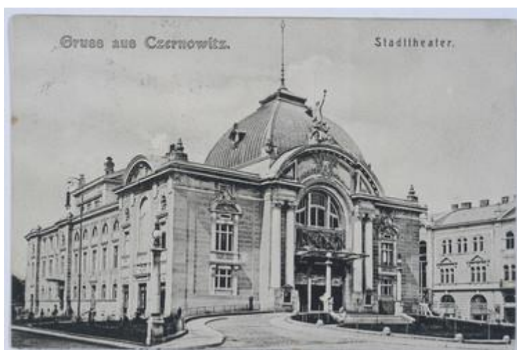
Teatr w Czerniowcach – wtedy zabór austriacki; <<W latach 1918–1940 należało do Rumunii>>