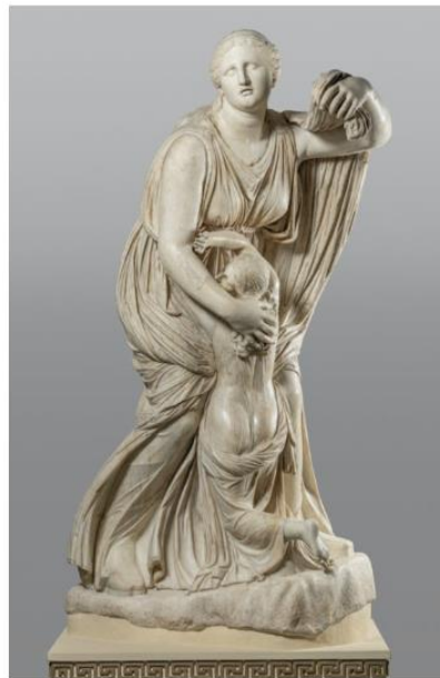
Niobe with her younger daughter

Eseista jedzie na wakacje do Florencji, może będzie na wystawie ta rzeźba